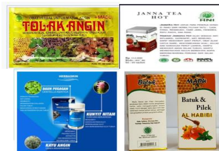
Gambar 3. Pemanfaatan Usnea dalam Berbagai Produk Obat Herbal Terstandar (OHT) Dan Kecantikan

Kayu angin juga digunakan untuk campuran obat luar dan kosmetik dalam, seperti jerawat, penghalus kulit, pengencang kulit, obat luka-luka, kudis, gatal-gatal dan sebagai pelancar peredaran darah, sedangkan untuk campuran obat tradisional dalam untuk bedak kulit yang dapat membuat kulit tampak segar berseri-seri dan cerah (Hutapea, J., dkk, 1992). Selain itu, Usnea juga ditemukan sebagai salah satu bahan produk Obat Herbal Terstandar (OHT) seperti tolak angin, janna tea hot, campuran madu al habibi dan herbaskin (Gambar 3). Usnea bisa digunakan untuk mengobati berbagai macam penyakit, karena mengandung berbagai macam metabolit sekunder. Setiap spesies Usnea mengandung perbedaan kandungan metabolit sekunder yang spesifik. Kandungan metabolit sekunder seperti lecanoric acid , dan usnic acid dimanfaatkan untuk antioksidan, antimikroba dan induksi apoptosis pada sel kanker (Luo, 2009; Backorova, 2012). Selain itu, usnic acid juga bisa digunakan untuk bahan pengawet.