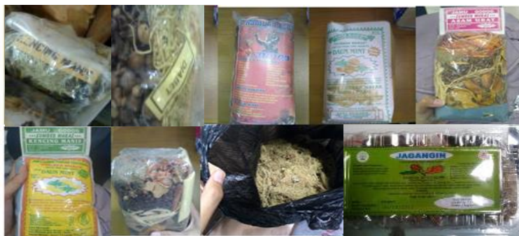
Gambar 2. Pemanfaatan Usnea dalam Produk Jamu Tradisional

masyarakat sunda sebagai jamu sariawan, disentri, masuk angin, erupsi kulit, kaku, nyeri haid, wasir, ibu melahirkan, dan bahan bedak wanita bangsawan (Noer, dkk, 2015).