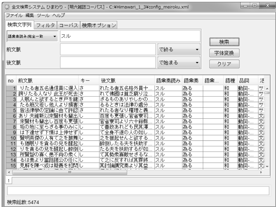
図 3 「ひまわり」での検索結果表示

次に「検索文字列」欄（図 1 参照）に検索したい文字列を入力する。「字体変換」ボタン（図 1 参照）をクリックすると、入力文字列に異体字がある場合は異体字を含めた検索ができるように「検索文字列」欄の入力が変換される。そして「検索」ボタン（図 1 参照）をクリックすると「検索結果」欄（図 1 参照）に検索結果が KWIC 形式で表示される（図 3）。