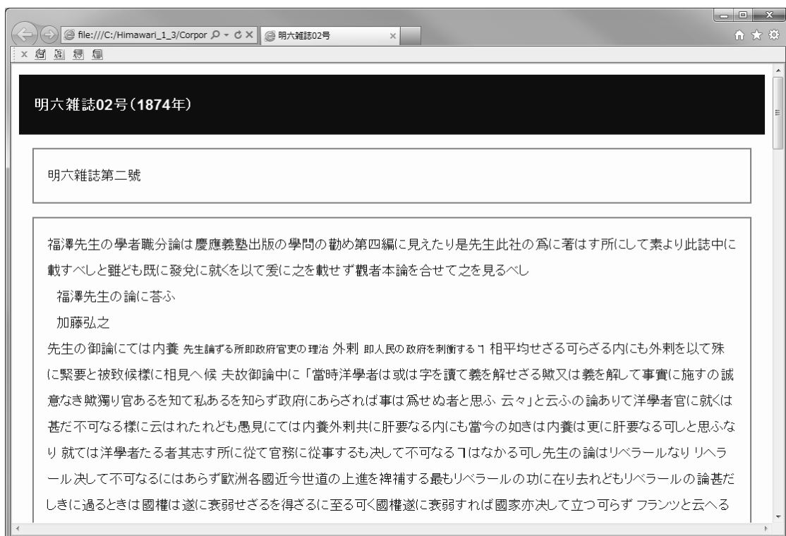
図5 「本文」スタイルでの文脈表示