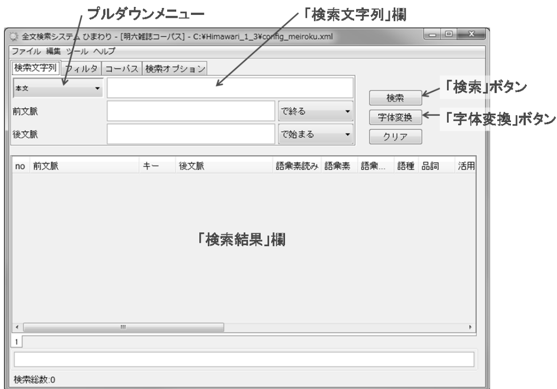
図1 「ひまわり」の起動画面

次に、画面上部の「ファイル」メニュー 「新規」を選択する（図2）。すると、設定ファイルを指定するための画面が現れるので、「config_meiroku.xml」を選択する。