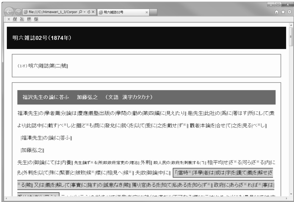
図4 「本文 + 付加情報」スタイルでの文脈表示