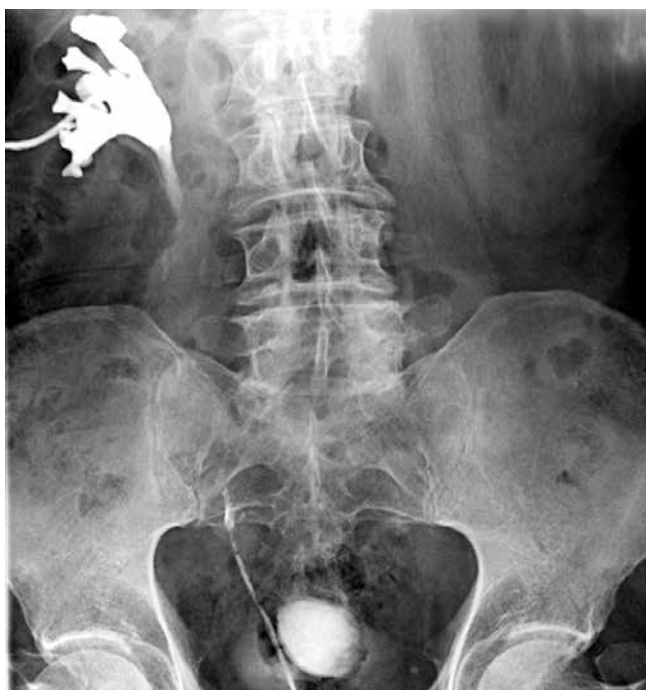
Рис. 2. Пациент С., 67 лет. Дефект мочеточника после лапароскопической резекции восходящего отдела сигмовидной кишки. По данным антеградной уретеропиелографии и ретроградной уретерографии выявлен диастаз краев мочеточника около 7 см

Fig. 1. Patient M., 67 years old. Ureter defect after laparoscopic resection of the descending sigmoid colon. Computed tomography revealed a defect in the left ureter with a contrast drug flowing into the abdominal cavity, small pelvis