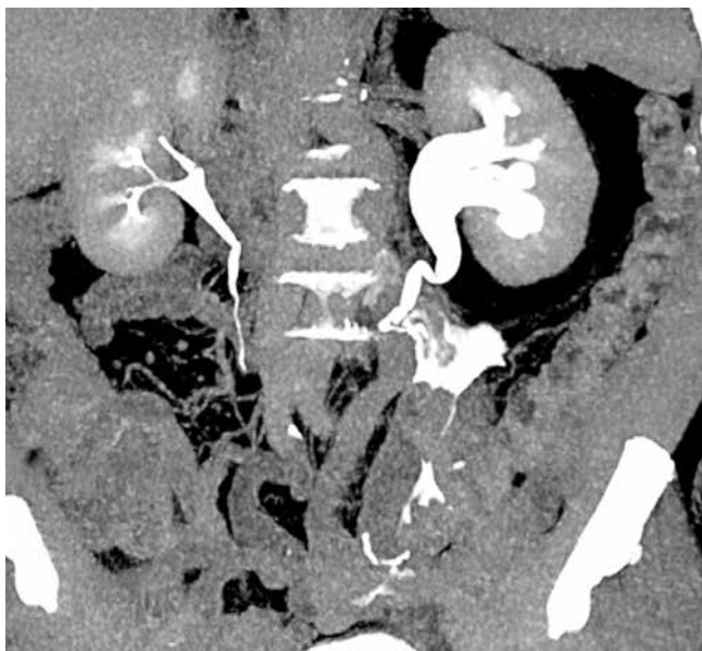
Рис. 1. Пациент М., 67 лет. Дефект мочеточника после лапароскопической резекции нисходящего отдела сигмовидной кишки. По данным компьютерной томографии выявлен дефект левого мочеточника с затеком контрастного препарата в брюшную полость, малый таз

Fig. 1. Patient M., 67 years old. Ureter defect after laparoscopic resection of the descending sigmoid colon. Computed tomography revealed a defect in the left ureter with a contrast drug flowing into the abdominal cavity, small pelvis