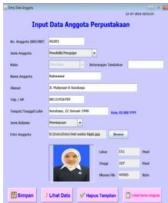
Gambar 6. Tampilan Form Input Data Anggota.