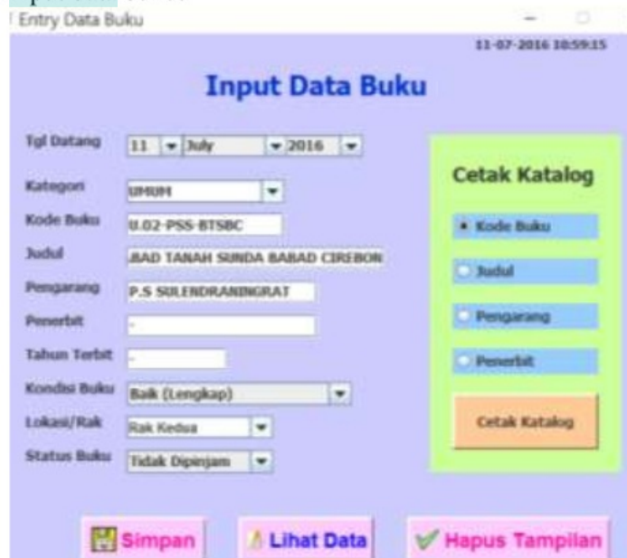
Gambar 5. Tampilan Form Input Data Buku.

Data buku 16 olah bisa diedit atau ditambahkan apabila terdapat buku baru dengan melakukan input data buku.