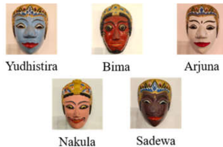
Gambar 1. Contoh gambar pandawa

Data yang digunakan dalam penelitian ini adalah gambar topeng pandawa dengan total data sebanyak 500 gambar. Gambar topeng pandawa terdiri dari 5 kelas, masing-masing kelas mempunyai 100 gambar. Untuk contoh gambar bisa dilihat pada gambar 1.