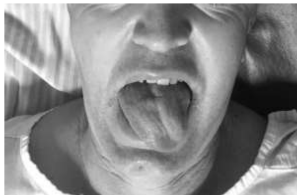
Figura 01 – Desvio da língua para esquerda.

Foi solicitada angioressonância de crânio e pescoço, que revelou trombo intramural na carótida interna esquerda, sugestivo de dissecação arterial (Figura 02).