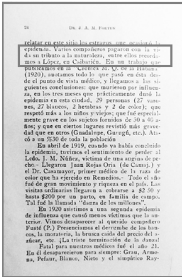
Figura 3. Libro "La Medicina en Remedios y su Jurisdicción" del Doctor José A. Martínez Fortún del año 1930.

que podían contener los agentes virales. Desde aquella época se conocía que con la tos y el estornudo se lanza a varios metros la infección. (9)