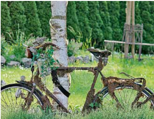
Gutes tun und Abfall vermeiden ist einfach | CJD Fahrradwerkstatt

Schrott wird auf den Wertstoffhöfen angenommen oder von privaten Entsorgungsunternehmen gesammelt. Bitte beachten Sie die Anzeigen in diesem Abfallkalender oder schauen Sie im Branchenbuch nach.