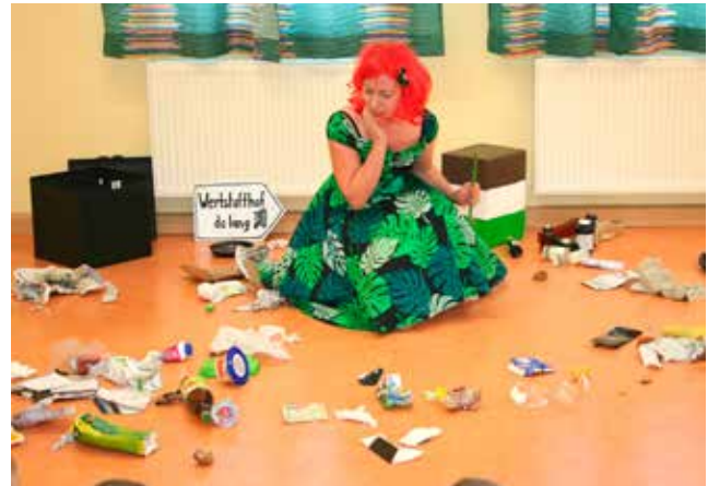
Unser Mitmachtheater für Kinder bis 10 Jahre

Buchung direkt: christina@christina-kraft.de Betreff: MitmachTheater