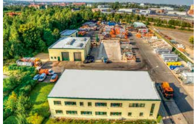
Betriebs- und Wertstoffhof Freiberg

Achtung! Bitte beachten Sie, dass Wertstoffhöfe eigene Öffnungszeiten haben. Dazu mehr auf Seite 13.