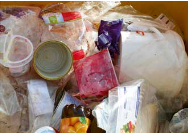
Die Entsorgung der Verpackungen (Gelbe Tonne) bezahlen Sie schon beim Kauf der Produkte an der Ladenkasse.

Andere Abfälle aus Plastik , wie Trinkbecher, Eimer oder Spielzeug gehören zum Restabfall (Graue Tonne).