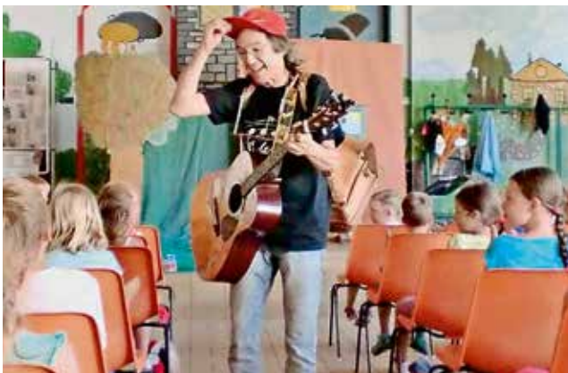
Mit Herz und Gitarre für eine saubere Umwelt © Grundschule Triefenstein, 07/2015