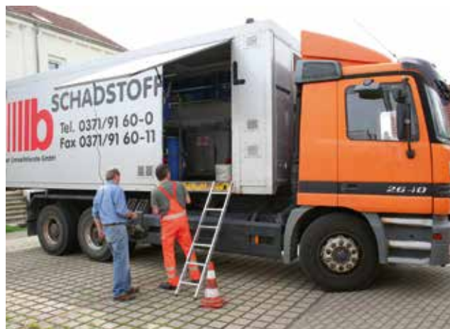
Das Schadstoffmobil hält zweimal im Jahr in allen Städten und Gemeinde

Leere Farbeimer und restentleerte Spraydosen gehören in die Gelbe Tonne . Eintrocknete, wasserlösliche Farben in den Restabfall behälter.