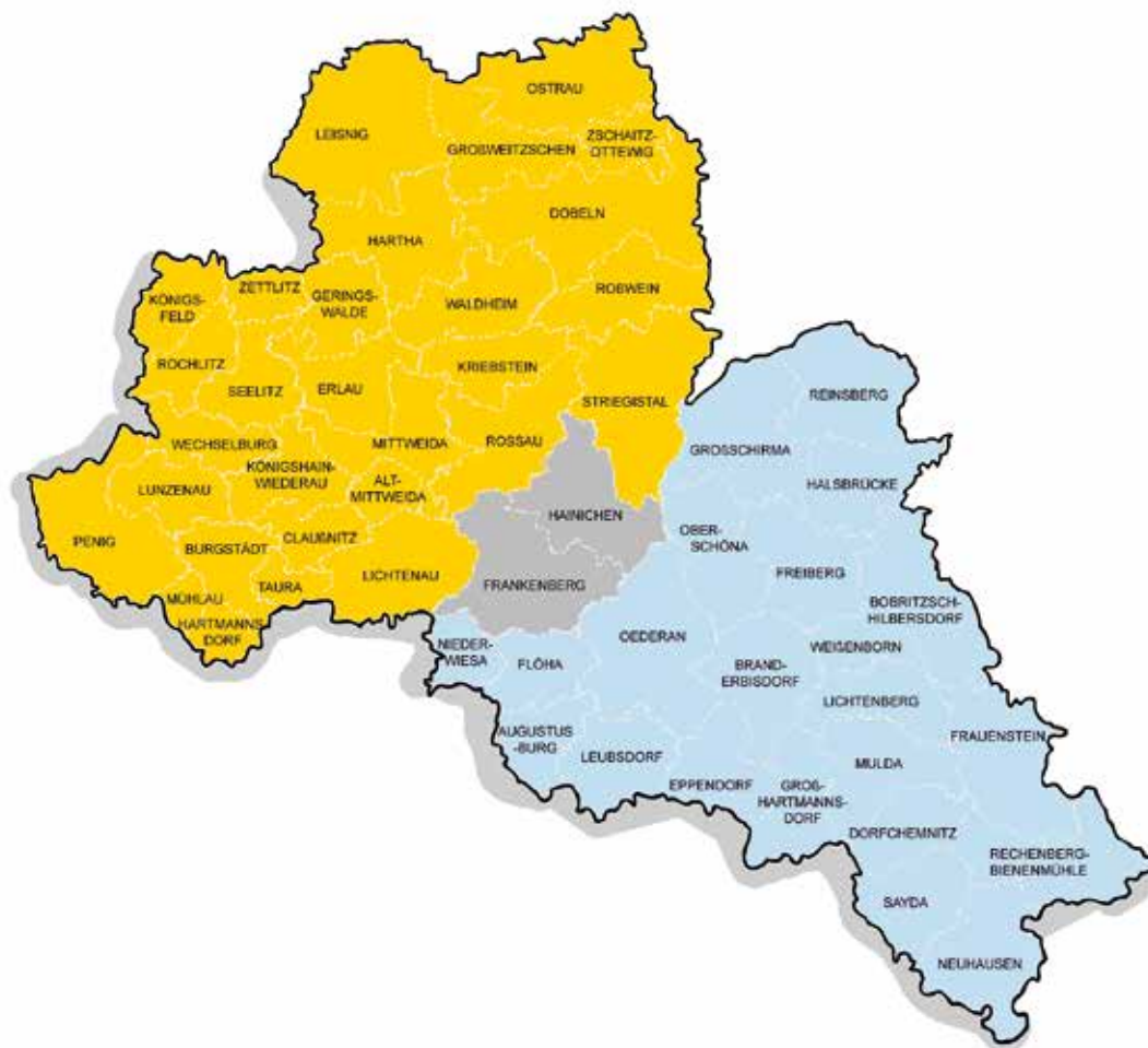
Grafik: Bianka Behrami | GRAFIK & ART