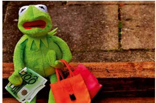
Überkonsum macht nicht glücklich! Überlegen Sie vorab was sie brauchen.