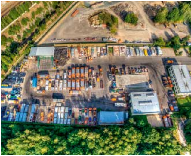
Betriebshof und Wertstoffhof Freiberg

Im gesamten Landkreis gibt es zehn Wertstoffhöfe für Wertstoffe und Abfälle.