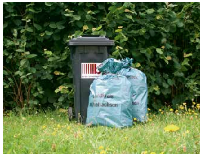
Nur Blaue Säcke mit dem Aufdruck „Restabfallsack Landkreis Mittelsachsen“ werden mitgenommen

A ugustusburg, B obritzsch-Hilbersdorf, B rand-Erbisdorf, C laußnitz, E ppendorf, E rlau, F löha OT Falkenau (Bürgerbüro), F rankenberg, F reiberg (Bürgerhaus/Obermarkt 21), G eringswalde, G roßhartmannsdorf, G roßschirma, H ainichen, H artha, H artmannsdorf, K önigshain-Wiederau, K riebstein, L ichtenau, L ichtenberg, L eisnig, L eubsdorf, L unzenau, M ulda, M ühlau, N euhausen, N iederwiesa, O ederan, O strau, P enig, R echenberg-Bienenmühle, R einsberg, R ochlitz, R ossau, R oßwein, S triegistal, W aldheim, W echselburg.