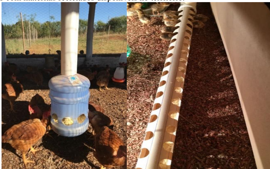
Figura 4: Comedouros para fase adulta e infantil das aves, confeccionados no curso de capacitação com materiais reciclados disponíveis no território.