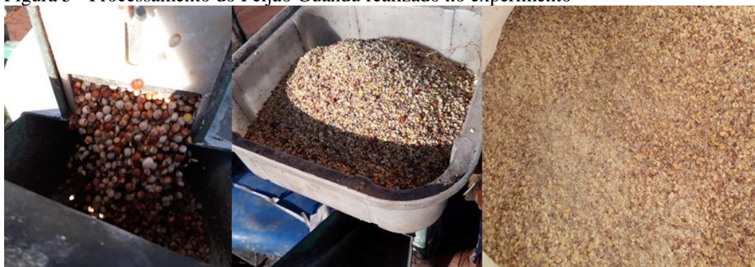
Figura 5 - Processamento do Feijão Guandu realizado no experimento