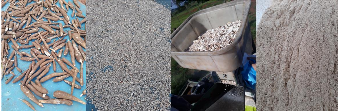
Figura 6 - Etapas do processamento da raiz da mandioca utilizada no experimento