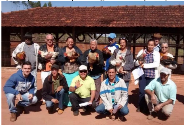
Figura 2 - Curso de capacitação sobre as questões genéticas da produção avícola