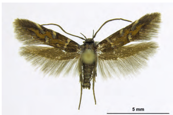
Fig. 13: Pancalia nodosella (BRUAND, 1851) (Seite 48) Oderberg/Pimpinellenberg (18.V.1997 leg. det. et coll. Theimer). - Nur in den Bundesländern Saarland und Brandenburg nachgewiesen; Aufn. C. Kutzscher.