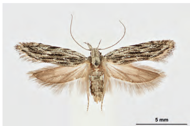
Fig. 18: Anarsia innoxia GREGERSON & KARSHOLT, 2017 (Seite 57) Eberswalde/Stadtgebiet: Kleingartenanlage im Schwärzetal nördlich Forstbotanischer Garten (23.VI.2016 LF leg. et coll. Schwabe det. K. Gregersen). - Neu in Brandenburg einschließlich Berlin; Aufn. M. Schröter.