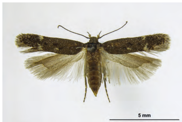
Fig. 16: Bryotropha umbrosella (ZELLER, 1839) (Seite 51) Eberswalde Umg./Spechthausen – Finow (18.VI.1968 1F leg. Friese det. Karsholt coll. SDEI). - Neu im Land Brandenburg; Aufn. C. Kutzscher.