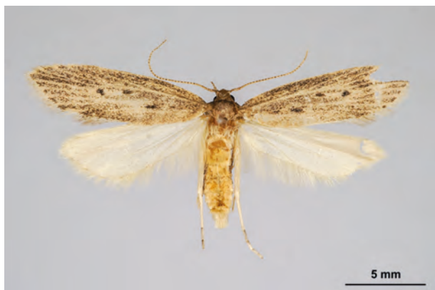
Fig. 15: Atremaea lonchoptera STAUDINGER, 1871 (Seite 49) Eberswalde/Stadtgebiet: Kleingartenanlage im Schwärzetal nördlich Forstbotanischer Garten (23.VI.2016 LF leg., det. et coll. Schwabe). - Nur in BB nachgewiesen; Aufn. K. Schwabe.