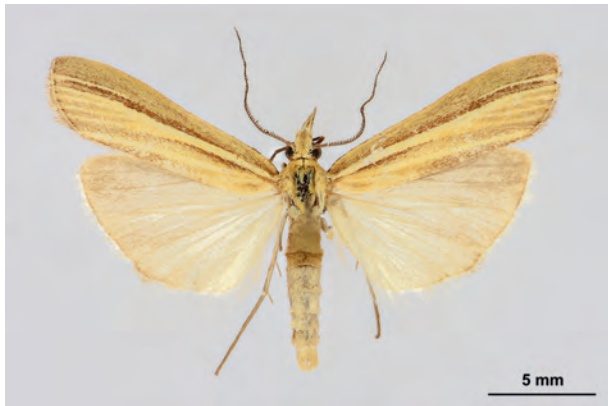
Fig. 33: Agriphila deliella (HÜBNER, 1813) (Seite 124-125) Zerpenschleuse/Ortsgebiet: Berliner Straße, im Garten (31. VIII.2014 LF 1F leg., det. et coll. Busse). - RL Land Brandenburg: Kategorie 3 (gefährdet), RL Deutschland: Kategorie 2 (stark gefährdet); Aufn. M. Schröter.