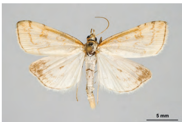
Fig. 41: Udea lutealis (HÜBNER, 1809) (Seite 144-145) Stecherschleuse Umg./am Rande des ehemaligen Kiesgrubengeländes nordöstlich des Ortes (01.VIII.2007 TF leg. et coll. Schwabe). - RL Deutschland: Kategorie 2 (stark gefährdet); Aufn. K. Schwabe.