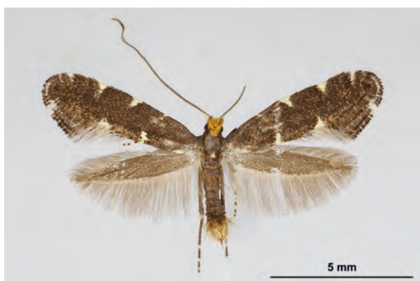
Fig. 03: Callisto denticulella (THUNBERG, 1794) (Seite 18) Eberswalde/Stadtgebiet: Kleingartenanlage im Schwärzetal nördlich Forstbotanischer Garten (11.V.2015 LF leg., det. et coll. Schwabe). - Wiederfund in Brandenburg; Aufn. K. Schwabe.