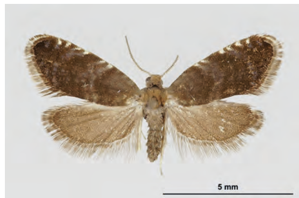
Fig. 24: Strophedra weirana (DOUGLAS, 1850) (Seite 101) Eberswalde Umg./Wiebecke-Damm am Möllergrab (P-Fund 16.I.2016, F e.p. im Zimmer 03.III.2016: leg., det. et coll. Schwabe). - Wiederfund in Brandenburg; RL Land Brandenburg: Kategorie 1 (überholt; Anm. Verf.); Aufn. K. Schwabe.