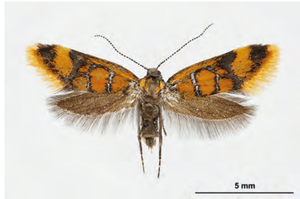
Fig. 08: Bisigna procerella (DENIS & SCHIFFERMÜLLER, 1775) (Seite 36) Finowfurt Umg./Moor an der Finowfließniederung nordöstlich Lehnsee (11.VII.2016 LF leg., det. et coll. Schwabe).