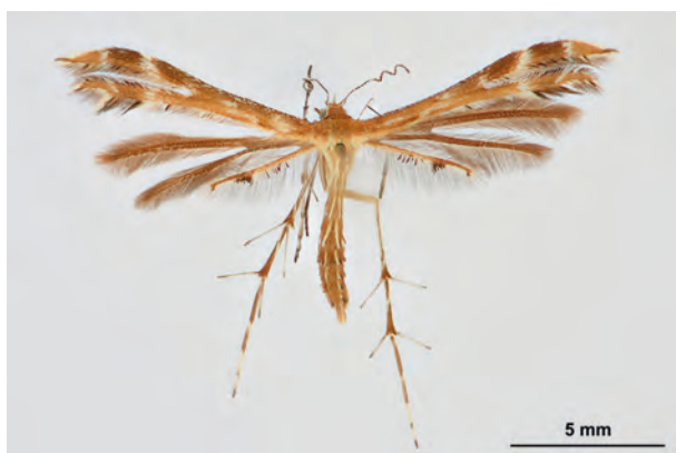
Fig. 25: Oxyptilus distans (ZELLER, 1847) (Seite 106) Eberswalde OT Finow/Stadtgebiet: Altenhofer Straße, im Garten (03. VIII.2019 Weibchen leg. et coll. Richert, det. genit. Schwabe). - Wiederfund in Brandenburg; RL Land Brandenburg: Kategorie 3 (gefährdet); Aufn. M. Schröter.