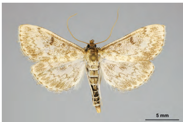
Fig. 39: Anania perlucidalis (HÜBNER, 1809) (Seite 143) Niederfinow Umg./Oder-Havel-Kanal westlich vom Schiffshebewerk (27.VIII.2016 LF leg. et coll. Schwabe). - RL Deutschland: Kategorie 3 (gefährdet); Aufn. K. Schwabe.