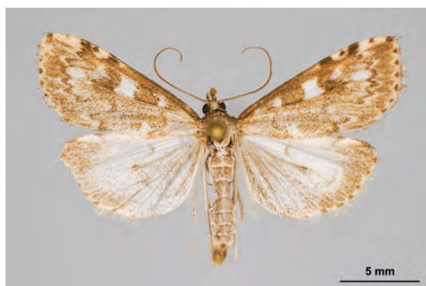
Fig. 42: Udea olivalis (DENIS & SCHIFFERMÜLLER, 1775) (Seite 145) Eberswalde/Stadtgebiet: Kleingartenanlage im Schwärzetal nördlich Forstbotanischer Garten (08.VI.2016 LF leg., det. et coll. Schwabe). - Wiederfund in Brandenburg; RL Land Brandenburg: Kategorie 0 (ausgestorben oder verschollen; Anm. Verf.: Kategorie überholt!); Aufn. K. Schwabe.