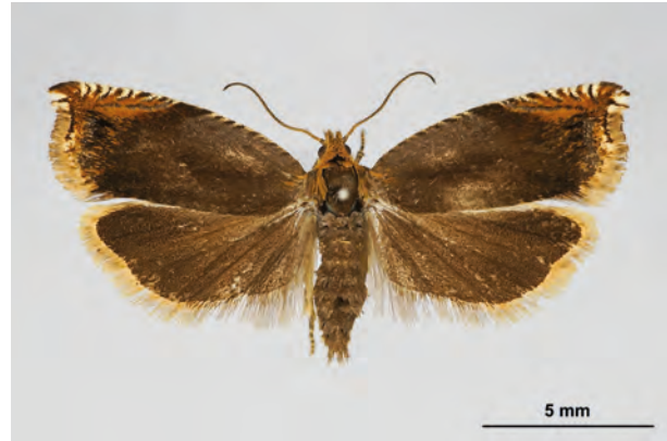
Fig. 22: Ancylis upupana (TREITSCHKE, 1835) (Seite 94) Oderberg/Geistberg (10.V.2018 LF leg., det. et coll. Schwabe). - RL Land Brandenburg: Kategorie 1 (vom Aussterben bedroht); Aufn. K. Schwabe.