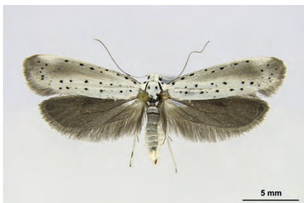
Fig. 05: Yponomeuta rorrella (HÜBNER, 1796) (Seite 22) Eberswalde OT Finow/Stadtgebiet: Altenhofer Straße, im Garten (24.VII.2019 e.l., leg., det. et coll. Richert). - Wiederfund in Brandenburg; Aufn. C. Kutzscher.