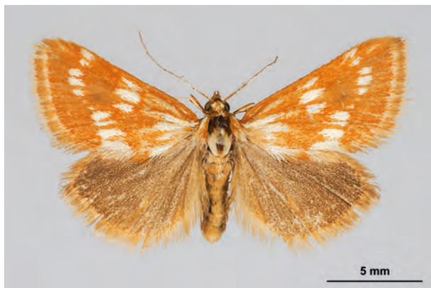
Fig. 35: Epascestria pustulalis (HÜBNER, 1823) (Seite 134) Gabow/Granitberggebiet (11.VI.2015 LF leg. et coll. Schwabe). - RL Deutschland und RL Land Brandenburg: Kategorie 3 (gefährdet); Aufn. K. Schwabe.