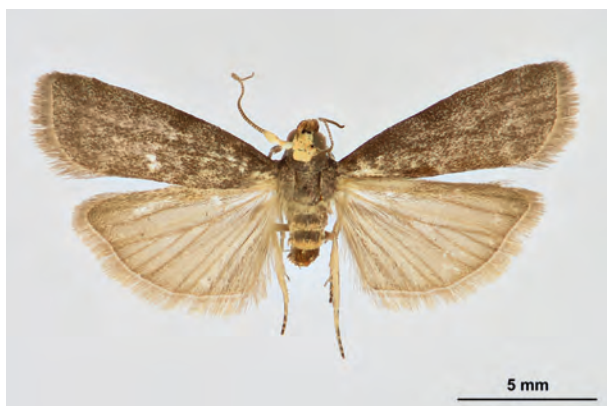
Fig. 27: Salebriopsis albicilla (HERRICH-SCHÄFFER, 1849) (Seite 111) Eberswalde OT Finow/Stadtgebiet: Altenhofer Straße, im Garten (17.V.2018 LF Männchen leg. et coll. Richert det. genit. Schwabe). - RL Land Brandenburg: Kategorie 2 (stark gefährdet); Aufn. M. Schröter.