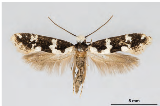
Fig. 01: Neurothaumasia ankerella (MANN, 1867) (Seite 14) Finowfurt Umg./Moor an der Finowfließniederung nordöstlich Lehnsee (11.VII.2016 LF leg., det. et coll. Schwabe). - Nur in Brandenburg und Sachsen nachgewiesen; Aufn. K. Schwabe.