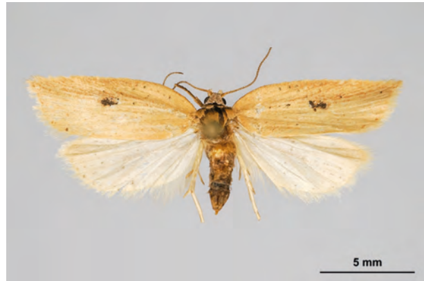
Fig. 20: Acleris lorquiniana (DUPONCHEL, 1835) (Seite 65-66) Tornow Umg./Barnimhänge nördlich des Ortes: Abt. 630 (05. VII.2009 LF leg., det. et coll. Schwabe). - RL Land Brandenburg: Kategorie 1 (vom Aussterben bedroht); Aufn. K. Schwabe.