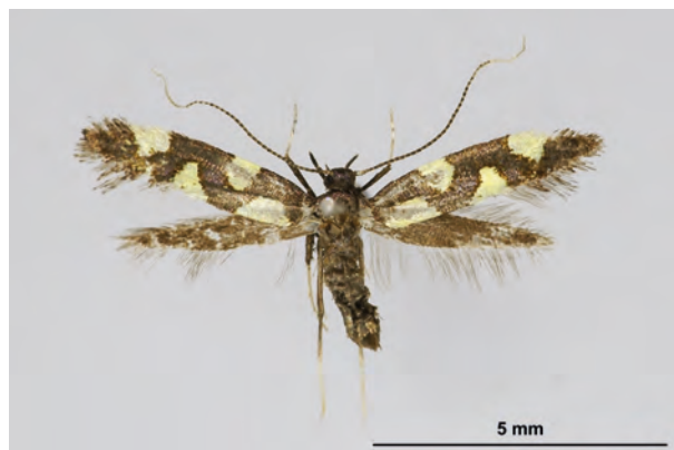
Fig. 02: Calybites quadrisignella (ZELLER, 1839) (Seite 18) Gersdorf Umg./Gamengrund südlich Teufelssee (08.VIII.2017 LF leg., det. et coll. Schwabe). - Nur in 4 Bundesländern nachgewiesen, aktuell nur in Brandenburg.