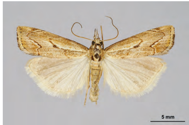
Fig. 34: Agriphila geniculea (HAWORTH, 1811) (Seite 126) Eberswalde/Stadtgebiet: Kleingartenanlage im Schwärzetal nördlich Forstbotanischer Garten (04.VIII.2014 LF leg. et coll. Schwabe). - RL Land Brandenburg: Kategorie 2 (stark gefährdet); Aufn. K. Schwabe.