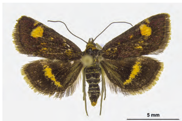
Fig. 38: Pyrausta porphyralis (DENIS & SCHIFFERMÜLLER, 1775) (Seite 138) Oderberg/Gebiet Pimpinellenberg-Teufelsberg (V. 1997 leg. et coll. Theimer). - RL Deutschland: Kategorie 2 (stark gefährdet), RL Land Brandenburg: Kategorie 1 (vom Aussterben bedroht); Aufn. C. Kutzscher.