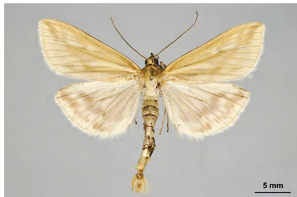
Fig. 36: Loxostege turbidalis (TREITSCHKE, 1829) (Seite 136) Stecherschleuse Umg./am Rande des ehemaligen Kiesgrubengeländes nordöstlich des Ortes (11.VI.2007 leg., det. et coll. Schwabe). - RL Deutschland: Kategorie 2 (stark gefährdet); Aufn. K. Schwabe.