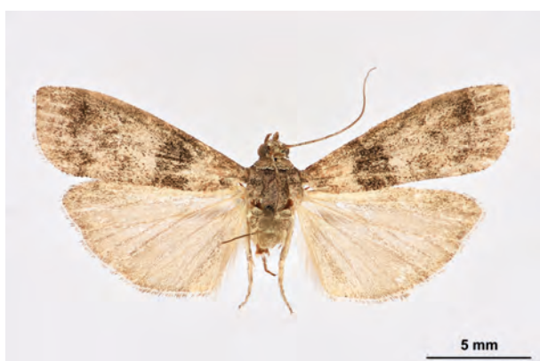
Fig. 29: Sciota rhenella (ZINCKEN, 1818) (Seite 112) Eberswalde OT Finow/Stadtgebiet: Altenhofer Straße, im Garten (30.VI. 2019 LF 1 Weibchen leg. et coll. Richert det. genit. Schwabe). - RL Deutschland und RL Land Brandenburg: Kategorie 3 (gefährdet); Aufn. M. Schröter.