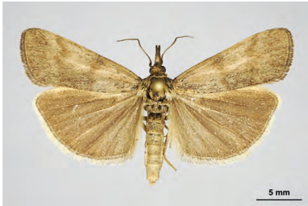
Fig. 31: Hypochalcia ahenella (DENIS & SCHIFFERMÜLLER, 1775) (Seite 115) Stolpe a. O./Trockenhänge am Stadtweg (14. VI.2018 LF leg. Richert coll. Schwabe). - RL Land Brandenburg: Kategorie 2 (stark gefährdet); Aufn. K. Schwabe.