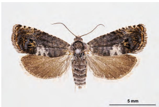
Fig. 23: Pammene herrichiana (HEINEMANN, 1854) (Seite 99) Eberswalde/Stadtgebiet: Kleingartenanlage im Schwärzetal nördlich Forstbotanischer Garten (17.V.2017 LF leg., det. et coll. Schwabe). - Neu in Brandenburg; Aufn. Schwabe.