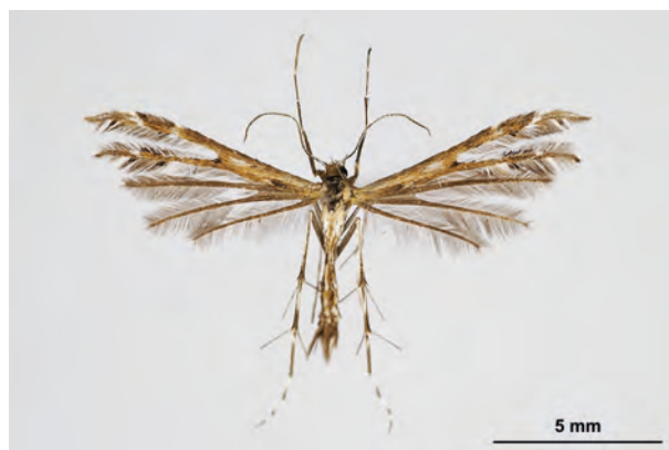
Fig. 26: Buckleria paludum (ZELLER, 1839) (Seite 107) Liepe Umg./Forst Chorin: NSG Plagefenn (24.VII.2019 TF leg. Richert, det. et coll. Schwabe). - RL Land Brandenburg: Kategorie 2 (stark gefährdet); Aufn. K. Schwabe.