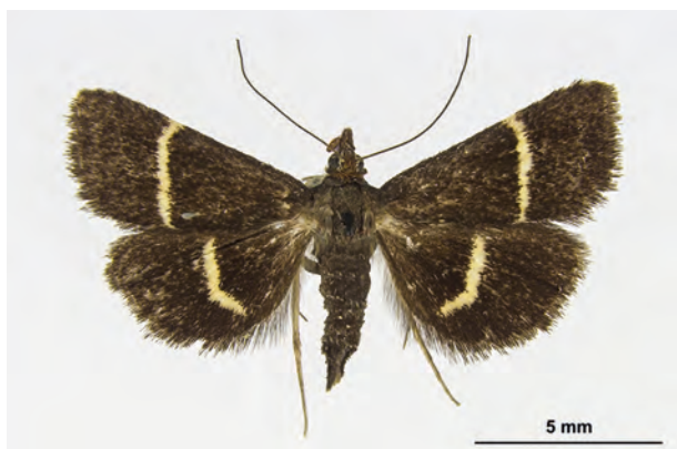
Fig. 37: Pyrausta cingulata (LINNAEUS, 1758) (Seite 137) Brodowin (18.VIII.1970 leg. Gaedike coll. SDEI). - RL Deutschland: Kategorie 2 (stark gefährdet), RL Land Brandenburg: Kategorie 3 (gefährdet); Aufn. C. Kutzscher.