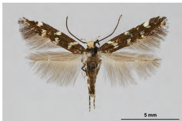
Fig. 14: Eteobalea anonymella (RIEDL, 1965) (Seite 48) Altglietzen Umg./Gabower Berge („Gabower Hangkante“) (11.VI.2015 LF leg., det. et coll. Schwabe). - Nur in 6 Bundesländern nachgewiesen, aktuell nur in Bayern, Brandenburg und Sachsen; Aufn. K. Schwabe.