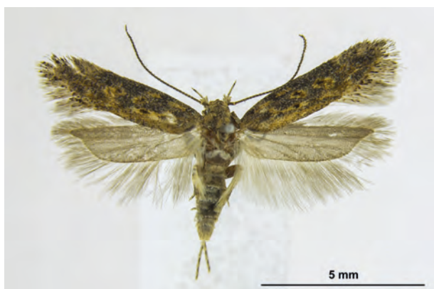
Fig. 17: Scrobipalpa ocellatella (BOYD, 1859) (Seite 55) Eberswalde/Stadtgebiet: Kleingartenanlage im Schwärzetal nördlich Forstbotanischer Garten (29.VIII.2018 LF 1 Männchen leg., Genit. - Präp. et coll. Schwabe det. F. Graf ). - Nach WEIDLICH 2019 neu in Brandenburg; unser Nachweis als weitere Bestätigung des Vorkommens im Land; Aufn. C. Kutzscher.