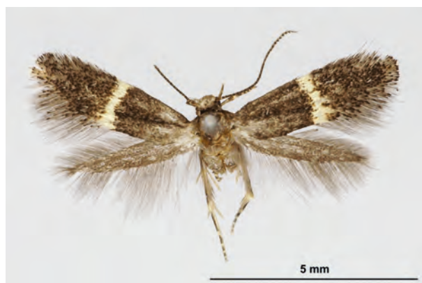
Fig. 06: Elachista obliquella STAINTON, 1854 (Seite 34) Oderberg/Geistberg (05.VI.2017 TF Weibchen leg., det. genit. et coll. Schwabe). - Wiederfund in Brandenburg; Aufn. K. Schwabe.