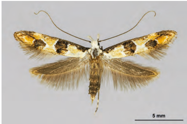
Fig. 07: Heinemannia festivella (DENIS & SCHIFFERMÜLLER, 1775) (Seite 35) Oderberg/Geistberg (10.VI.2017 LF leg., det. et coll. Schwabe). - Wiederfund in Brandenburg; Aufn. K. Schwabe.