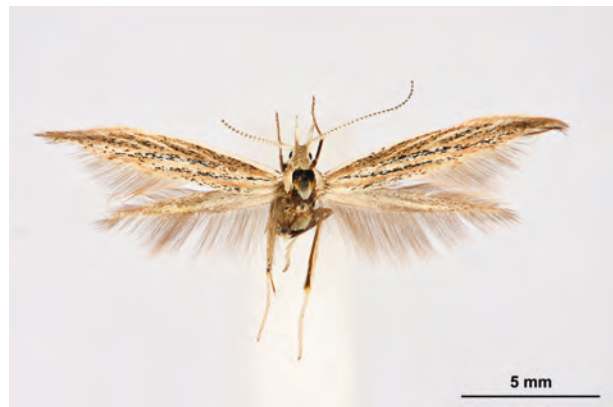
Fig. 12: Coleophora expressella KLEMIENZIEWICZ, 1902 (Seite 45) Altgietzen Umg./Ödland südwestlich des Ortes (11.VIII.2019 LF Weibchen leg., det. genit. et coll. Schwabe). - Nur in den Bundesländern Brandenburg, Sachsen und Thüringen nachgewiesen; Aufn. M. Schröter.