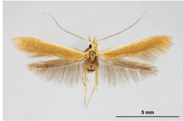
Fig. 10: Coleophora ochripennella ZELLER, 1849 (Seite 39) Oderberg/Geistberg (10.VI.2017 LF Männchen leg., det. genit. et coll. Schwabe). - Wiederfund in Brandenburg; Aufn. K. Schwabe.