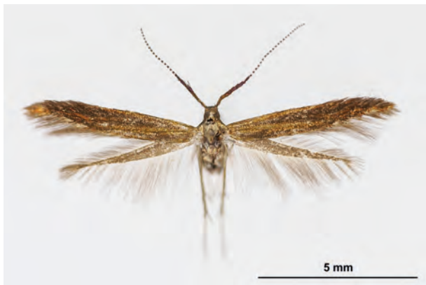
Fig. 11: Coleophora variicornis TOLL, 1952 (Seite 41) Oderberg/Geistberg (03.VII.2017 TF Männchen leg., det. genit. et coll. Schwabe). - Nur in den Bundesländern Bayern, Brandenburg und Sachsen nachgewiesen; Aufn. K. Schwabe.