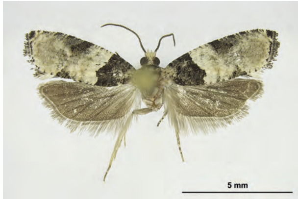
Fig. 21: Gibberifera simplana (FISCHER v. RÖSLERSTAMM, 1836) (Seite 85) Eberswalde OT Finow/Stadtgebiet: Altenhofer Straße, im Garten (30.V.2018 LF Männchen leg. et coll. Richert det. genit. Schwabe). - Wiederfund in Brandenburg; Aufn. C. Kutzscher.