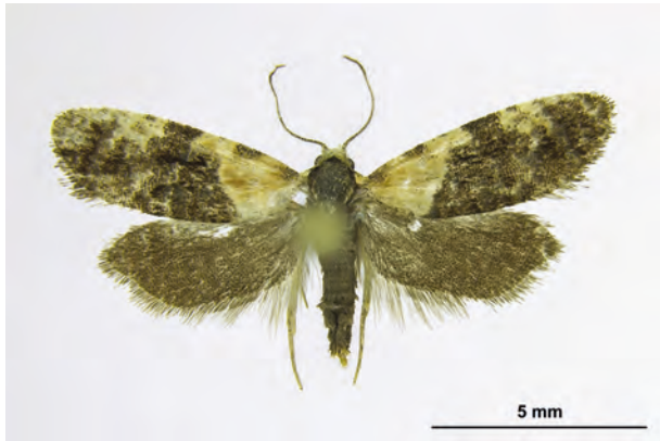
Fig. 19: Phtheochroa schreibersiana (FRÖLICH, 1828) (Seite 59) Eberswalde OT Finow/Stadtgebiet: Altenhofer Straße, im Garten (03.VI.2019 LF leg. et coll. Richert det. Schwabe). - RL Land Brandenburg: Kategorie 1 (vom Aussterben bedroht); Aufn. C. Kutzscher.