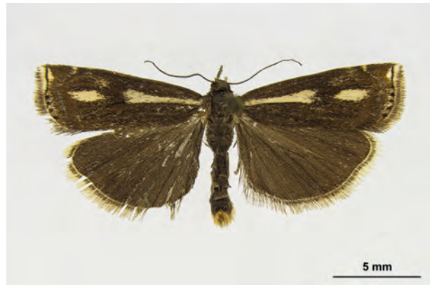
Fig. 32: Crambus heringiellus (HERRICH-SCHÄFFER, 1848) (Seite 123) Spechthausen Umg./Fischbruthaus (19.VII.1966 leg. Friese coll. SDEI). - RL Deutschland und RL Land Brandenburg: Kategorie 2 (stark gefährdet); Aufn. C. Kutzscher.