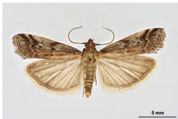
Fig. 28: Delplanqueia dilutella (DENIS & SCHIFFERMÜLLER, 1775) (Seite 112) Stolpe a. O./Trockenhänge am Stadtweg (14. VI.2019 LF 1F leg. et coll. Richert det. Schwabe). - Wiederfund in Brandenburg; RL Land Brandenburg: Kategorie 1 (vom Aussterben bedroht); Aufn. M. Schröter.