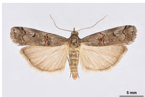
Fig. 30: Pempelia palumbella (DENIS & SCHIFFERMÜLLER, 1775) (Seite 113) Eberswalde OT Finow Umg./Forst Finowtal: Einflugschneise Flugplatz (11.VII.2019 TF 1F leg. et coll. Richert det. Schwabe). - RL Deutschland und RL Land Brandenburg: Kategorie 3 (gefährdet); Aufn. M. Schröter.