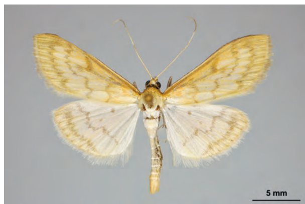
Fig. 40: Paratalanta pandalis (HÜBNER, 1825) (Seite 144) Eberswalde Umg./Oberheide: Wiebecke-Damm am Möllergrab (25.V.2012 LF leg. et coll. Schwabe). - RL Deutschland und RL Land Brandenburg: Kategorie 2 (stark gefährdet); Aufn. K. Schwabe.