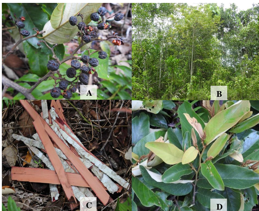
Gambar 2. Morfologi Tumbuhan Alphonsea incana BL. [A] Buah, [B] Perawakan pohon, [C] Kulit Batang, dan [D] Daun

Dari data hasil survei, selanjutnya dianalisis kandungan fitokimia batang tumbuhan Alphonsea incana BL. Analisis kandungan senyawa dilakukan di Laboratorium Kimia Organik Departemen Kimia IPB. Data hasil analisis disajikan pada Tabel 2.