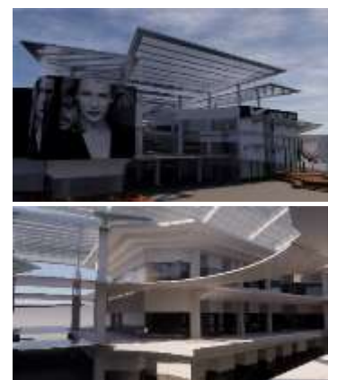
Tampilan eksterior yang menunjukkan keterbukaan mall terhadap konteks urban, juga tampilan interior yang menunjukkan sifat mall yang porous secara fisik