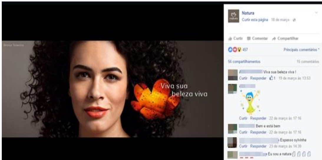
Figura 03 – Texto publicitário da Natura.

Utilizando um grande espaço no suporte, observamos uma relação harmoniosa entre a empresa Natura e seus consumidores. Ao contrário do anunciante anterior, nos anúncios analisados dessa marca não ocorreram críticas negativas à empresa, o que não quer dizer que elas não existam e que não sejam oportunas também. No texto publicitário em questão, a empresa Natura mostra a relação entre consumidor e produto consumido. Utilizando os recursos imagético e verbal, a marca busca convencer os usuários que usam esse suporte sobre a qualidade do produto.