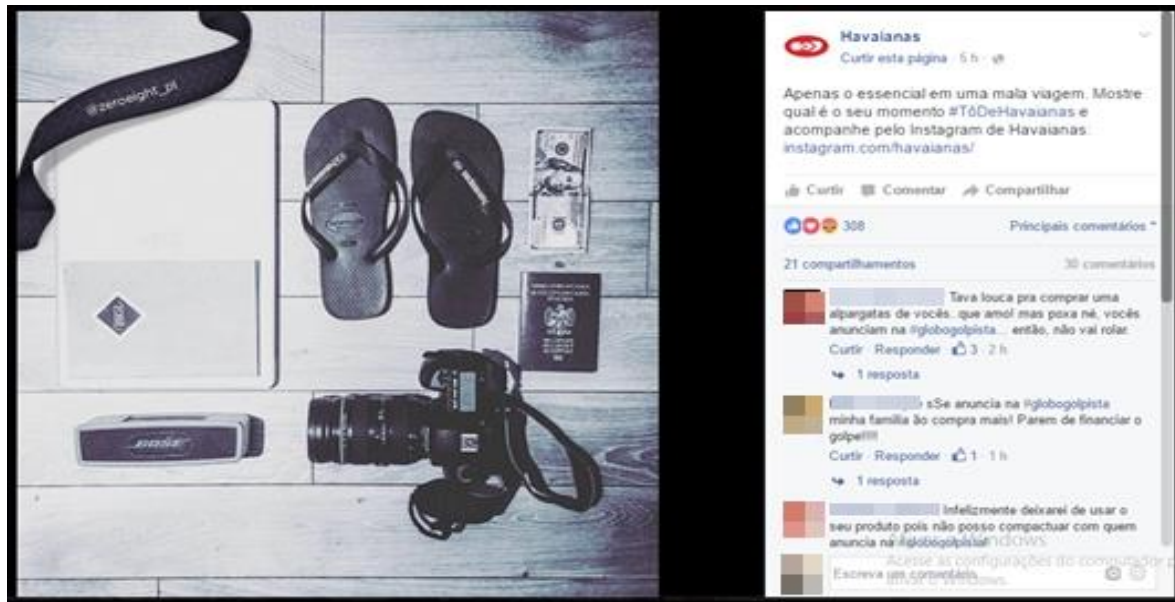
Figura 01 – Texto publicitário das Havaianas.

O texto publicitário das Havaianas (Figura 01), ora apresentado, constrói-se em grande parte de forma imagética. No entanto, a parte verbal que figura à direita nos parece o diferencial nesse anúncio, pois o texto completa-se pela linguagem verbal: “Apenas o essencial em uma mala (de) viagem. Mostre qual é o seu momento #TôDeHavaianas e acompanhe pelo Instagram de Havaianas: instagram.com/Havaianas/ ” (HAVAIANAS, 2016, não paginado), com que a marca tenta convencer o consumidor de que Havaianas é essencial. Além desse texto, há uma mensagem acima, do lado esquerdo na própria imagem (nome da conta do Instagram pertencente à pessoa que fez a fotografia), que colaboram para a construção do texto do anúncio. Essa ação constitui-se importante na constituição desse texto publicitário, pois a empresa utilizou-se de uma fotografia de um provável consumidor para fazer a publicidade de seus produtos. Embora esse seja um recurso já utilizado em anúncios impressos, ele se faz, no meio virtual, de forma mais dinâmica e real, já que registra, de fato, um usuário consumidor do produto. Há também um hyperlink 12 , recurso que permite o acesso ao site da empresa, fazendo com que os usuários consumidores sejam convidados a visitá-lo e a comprar os produtos ali ofertados.