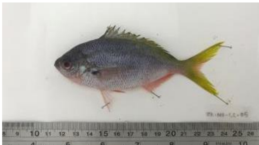
Gambar 2. Morfologi Ikan Ekor Kuning ( Caesio cuning )

di daerah karang. spesies ini tersebar luas di daerah terumbu karang hingga ke dalam 60 m (Carpenter, 1998). Hasil analisis pengukuran dan perhitungan karakter morfometrik ikan ekor kuning ( Caesio cuning ) dapat dilihat pada Tabel 1.