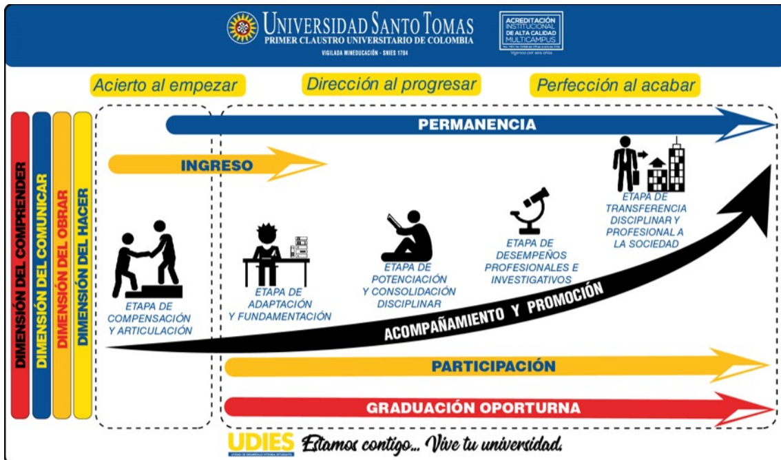
Figura 1. Modelo de Desarrollo Integral Estudiantil.