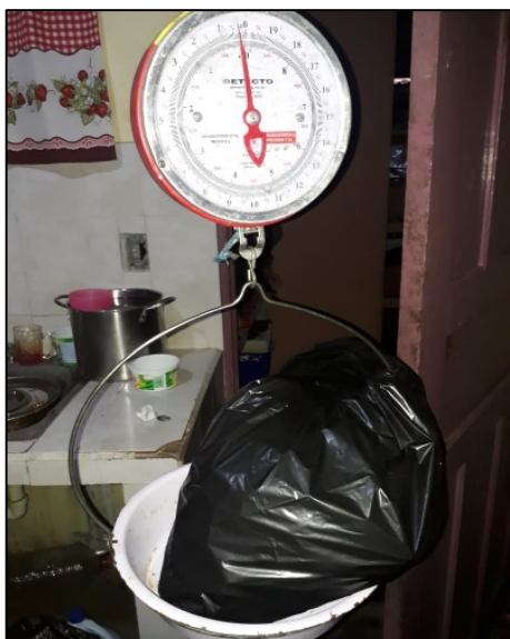
Figura 2. Pesaje semanal del material de descarte producido en cada una de las ocho viviendas.

Los datos obtenidos nos informan sobre la generación de plástico como descarte en el sector doméstico, lo cual podría ayudar en el sustento de estrategias de estudio y manejo de elementos reciclables en el material de descarte domiciliario.