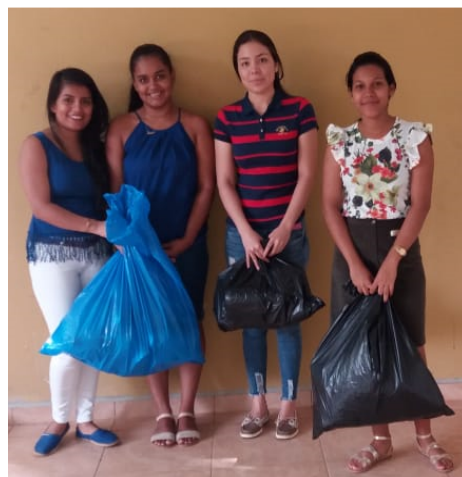
Figura 1. Recolección del material reciclable de descarte producido semanalmente en las viviendas estudiadas.

El muestreo se realizó entre los meses de julio y agosto de 2018. Se recolectó de manera semanal el material proporcionado en cada hogar hasta cumplir con un mes de recolecta en cada vivienda. Este material de descarte fue verificado para asegurar que cumpliera con la condición de reciclable y posteriormente se estimó su masa en kilogramos mediante el uso de una balanza colgante (figura 2).