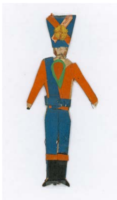
Det tidligste af de bevarede H.C. Andersen papirklip forestiller en soldat og kan dateres til omkring 1822.

Efter H.C. Andersens konfirmation måtte han alvorligt overveje, hvad han ville med sit liv. For at forfølge sin drøm om et liv i kunsten – og helst ved teatret – rejste han til København den 4. september 1819, kun 14 år gammel.