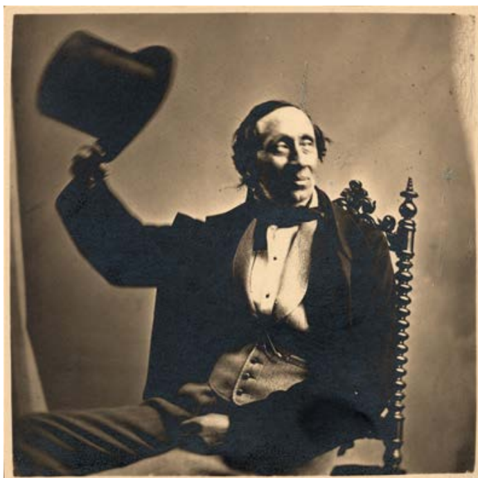
H.C. Andersen fotograferet på herregården Frijsenborg i 1865.

Når det gjaldt kunstens udødelighed, var H.C. Andersen pinagtigt bevidst om, at al kunst står i risiko for at blive glemt med tiden. Som vi ved, er det endnu ikke gået sådan med hans. Værkernes frodige fantasi har sat sit præg på den danske litterære stil og på det danske sprog, men har også rakt langt ud i verden. H.C. Andersens fine iagttagelsessans, indlevelsessevne, eksperimenterelyst og talent for komposition kommer stærkt til udtryk i hans litterære produktion såvel som i hans billedkunst, og de kvaliteter gør sit til, at man stadig med stort udbytte læser hans eventyr overalt i verden og fortolker dem i nye kunstneriske udtryksformer. Og så er det værd at have i baghovedet, at nok er der refleksioner og iagttagelser fra det levede liv at finde i dem – men det er også en forfatter, som mestrer kunsten at iscenesætte, der er på spil.