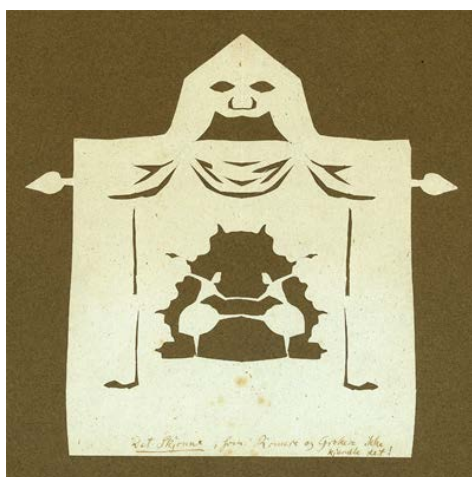
"Det Skjønne, som Romere og Grækere ikke kendte det." Teaterscener er et tilbagevendende motiv i H.C. Andersens papirklip.

Trods modgangen skrev H.C. Andersen i løbet af få uger en tragedie, Alf sol , og en fortælling inspireret af den skotske romanforfatter Sir Walter Scott – Gjenfærdet ved Palnatokes Grav . Værkerne blev med en selvbiografisk prolog udgivet under titlen Ungdoms-Forsøg med pseudonymet Villiam Christian Walter. Men bogen solgte ikke, og i september 1822 afviste teateret tragedien. I afslaget lød det dog, at forfatteren havde talent, og at han burde modtage en elementær uddannelse. H.C. Andersen modtog tilbuddet med taknemmelighed.