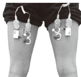
図1 音フィードバック用機器

文部科学省の研究助成（平成28年度科学研究費助成事業、若手B：16K16562）を受け、音フィードバックのシステム構築に着手した。システム構築には、（株）身のこなしラボラトリーの協力を得た。身のこなしラボラトリーは福井大学発のベンチャー企業であり、様々な助成金採択を受けながら、これまでに筋活動を音でフィードバックする『MUSCLE ALIVE（マッスルアライブ）』の開発に取り組み、商品化している（平成21年度福井県ふくい次世代技術育成事業補助金事業、他）。今回は、一般向けのトレーニング機器であるMUSCLE ALIVEを研究用にカスタマイズし、音フィードバックによるトレーニング効果を分析可能なシステムの構築を目指した（図1）。