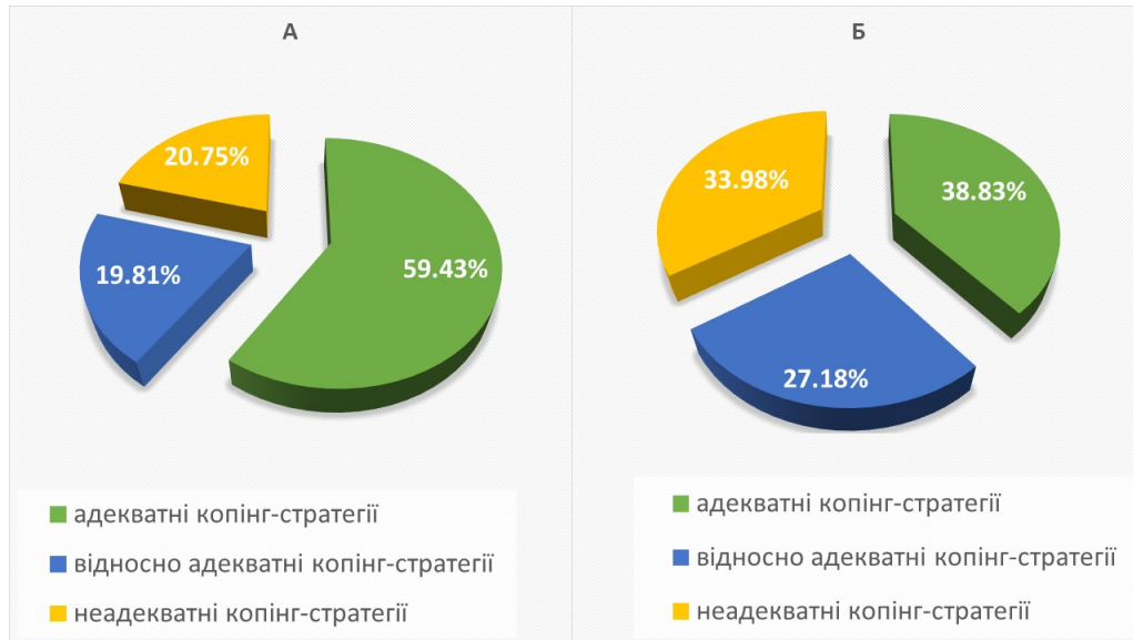
Рис. 2: Копінг-стратегії у хворих на рекурентний депресивний розлад та осіб без психічних розладів (за методикою E. Heim).