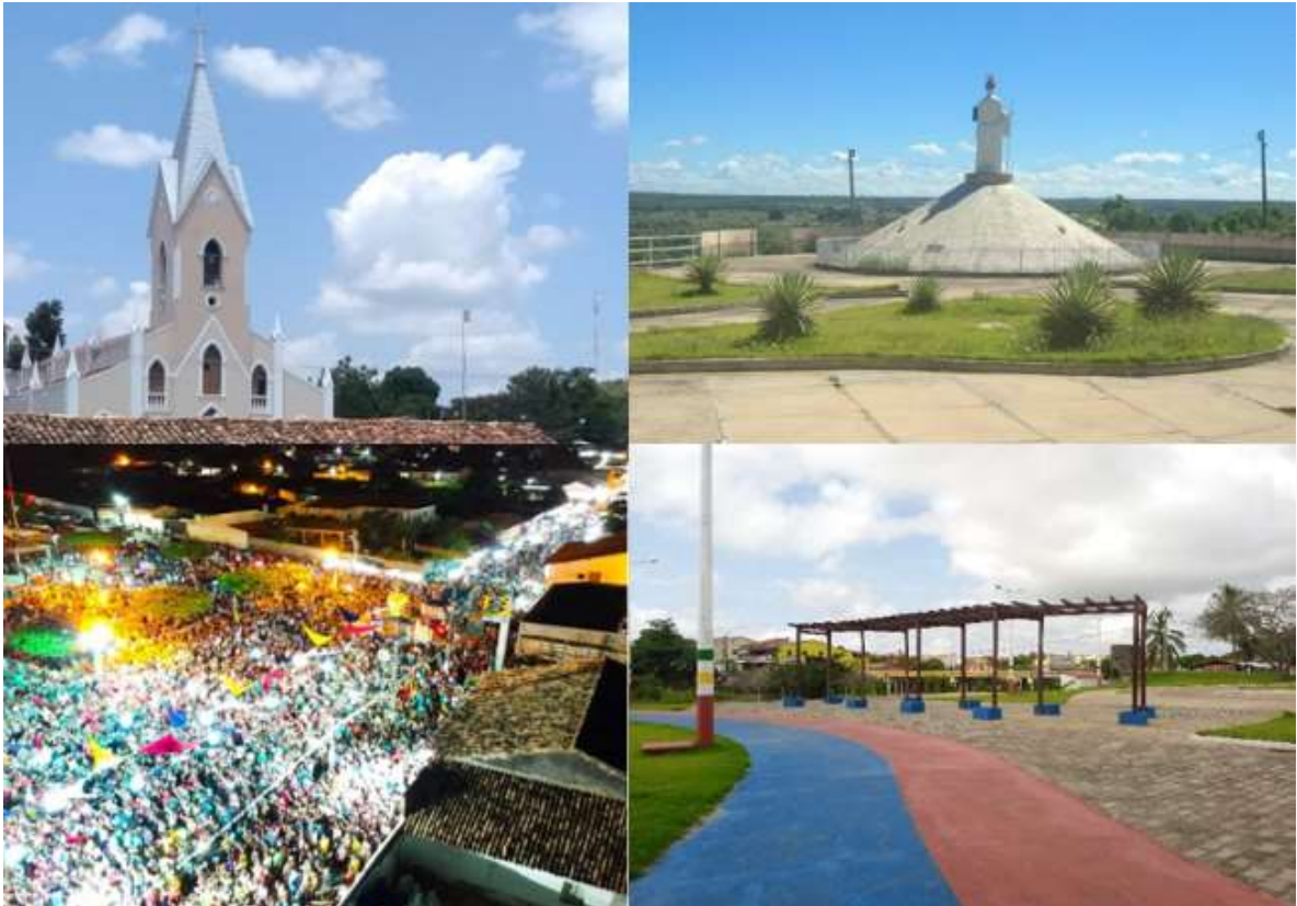
Imagem 1 - Recursos turísticos locais.

Diante do potencial turístico e das fragilidades apresentadas, é que se discute a aplicação do modelo de observatório do turismo, a fim de consolidar propostas que favoreçam o turismo local.