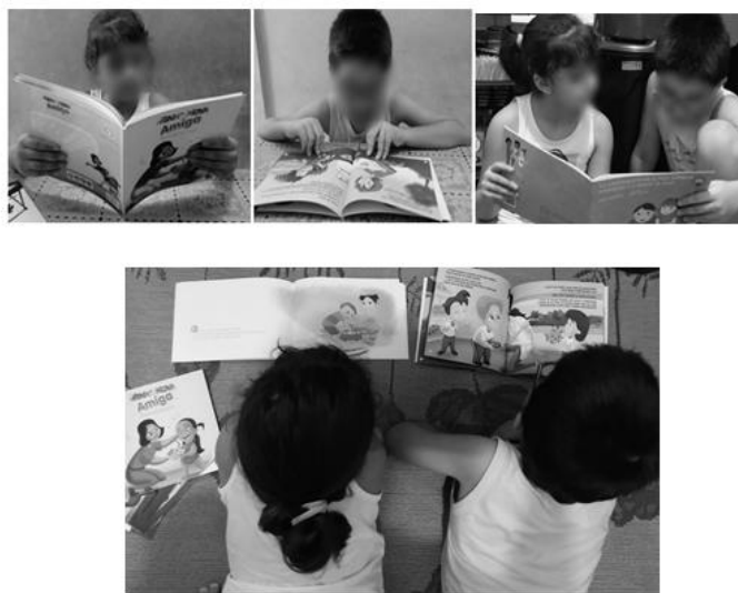
Figura 1 – Leitura individual ou em grupo