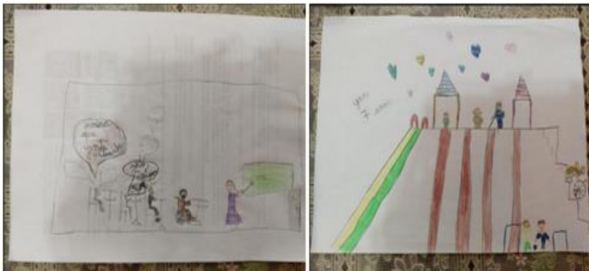
Figura 3 – Oficina de desenhos e recontar histórias: relatos de preconceito, amizade e de respeito