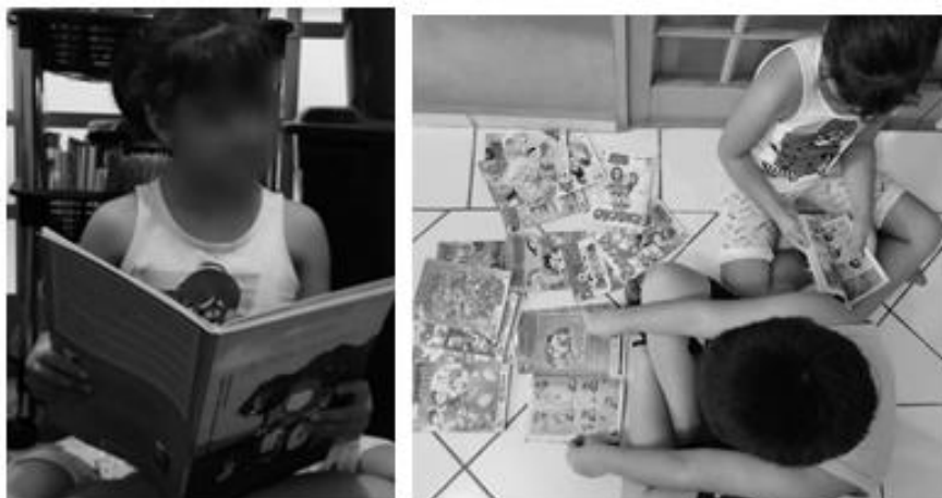
Figura 2 – Personagens conhecidos e desconhecidos envolvidos em muita diversão