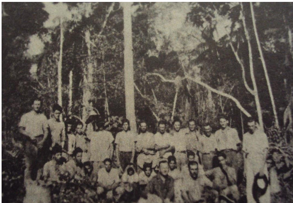
Figura 7 - Os primeiros migrantes trabalhando para a companhia Grasso e Mazzuco Ltda