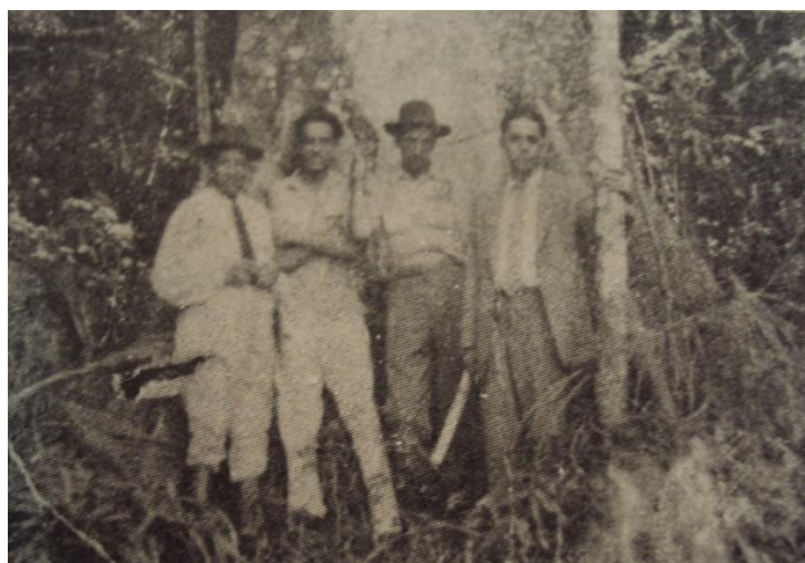
Figura 5 - Os primeiros migrantes da região