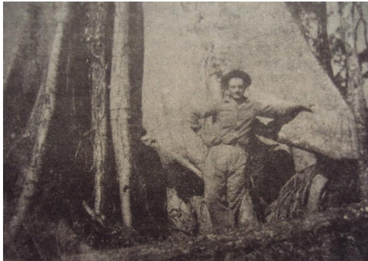
Figura 6 – Os primeiros migrantes de Ivatuba