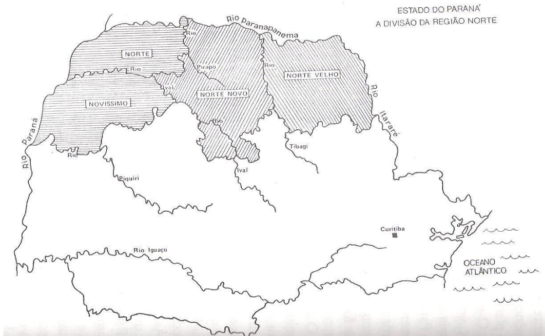
Figura 3 - Estado do Paraná, a divisão da região Norte