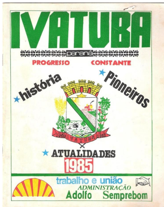
Figura 4 - Capa da revista “Ivatuba Progresso Constante”

A revista exibe capa colorida, no qual repousa o brasão da cidade junto com três palavras, ao lado: história, pioneiros e atualidades. Tais designações também marcarão o teor do conteúdo e o enfoque da publicação. Conforme se observa na imagem abaixo, está presente ainda o slogan da administração municipal, em destaque (Trabalho e União - Administração Adolfo Semprebom); em seu canto esquerdo, o símbolo da distribuidora de combustível Shell e, do outro lado, um desenho de um aperto de mão, fazendo alusão aos dizeres de união da então administração.