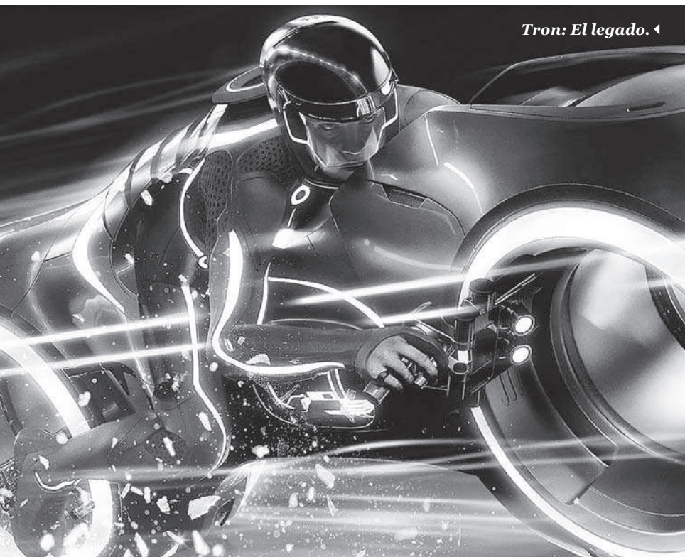
Tron: El legado. ◀