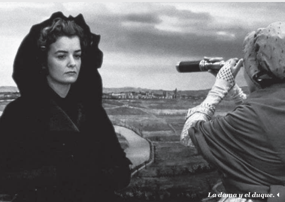
La dama y el duque. ◀

El videojuego es a la vez el agente del caos y el objeto de deseo para los protagonistas: la diseñadora de la industria de la realidad virtual Allegra Geller, interpretada por Jennifer Jason Leigh, y el practicante de marketing convertido en protector de Geller, encarnado por Jude Law. Existe un paralelo entre el procedimiento de colocación del equipo de juego con el ritual erótico previo a la penetración. Una atmósfera sexual empapa al videojuego por dentro y por fuera. Recordemos que durante el trance, los cuerpos se mueven como si estuviesen teniendo sexo.