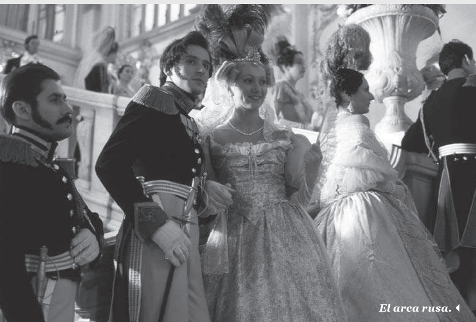
El arca rusa. ◀

La película es una proeza cinematográfica. Se realizó con una sola toma que duró alrededor de noventa minutos, y que se desplazó a través de los diversos pasillos del museo del Hermitage, uno de los más grandiosos del mundo, captando el desenvolvimiento coreográfico de más de dos mil actores y extras, al igual que tres orquestas. Toda una compleja puesta en escena no solo por sus condiciones técnicas, sino por la búsqueda de un clima de sueño; que se siente en esa enrarecida atmósfera de luces en penumbra, tenues, apagadas, que entran por las ventanas del museo y parecen de amanecer, propias de aquel momento del día en que aún dormitamos. Pero también en esos acordes de resonancias góticas que se repiten intermitentemente, mientras nuestra visión acompaña a dos personajes espectrales, inquietados por la riqueza artística y el pasado fastuoso del Hermitage: el Espía, personaje invisible representado por un encuadre subjetivo continuo, y el marqués de