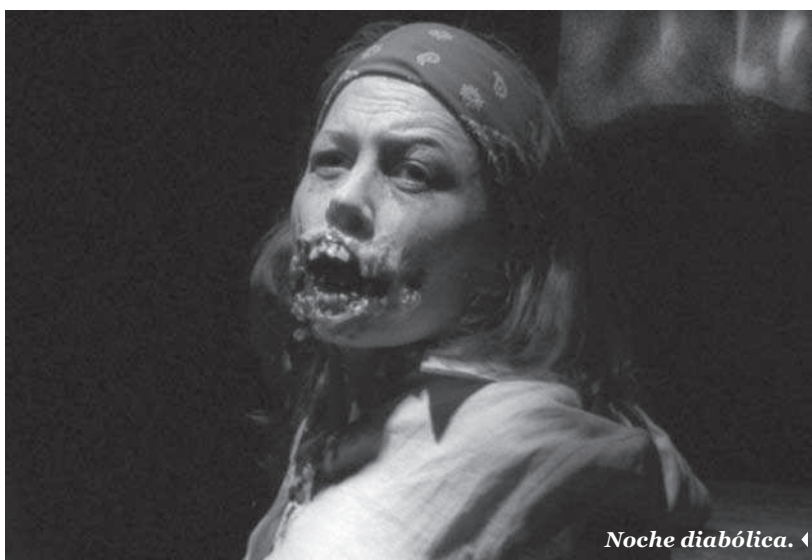
Noche diabólica. ◀