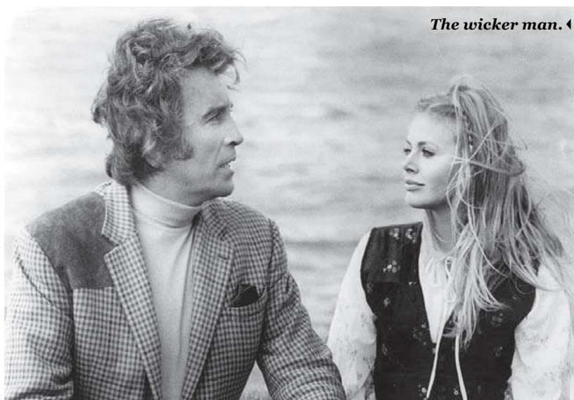
The wicker man. ◀