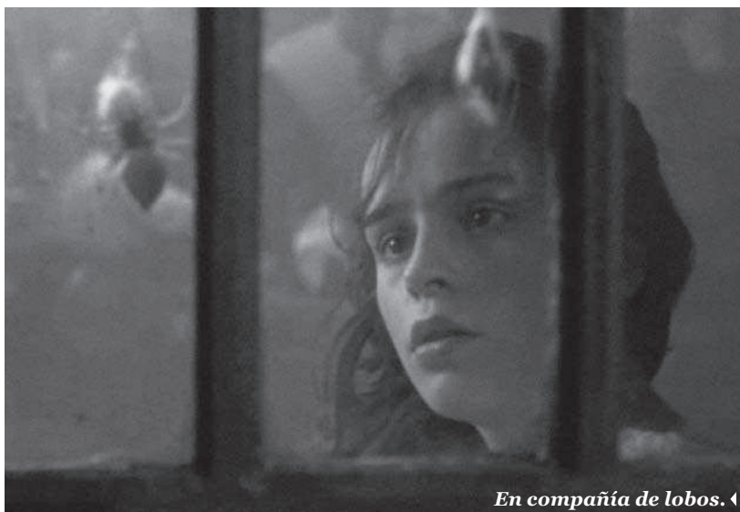
En compañía de lobos. ◀

La mayoría de las películas de terror de la década que acaba de pasar, especialmente las norteamericanas y las de otros países como Australia o Francia, demuestran varias coincidencias: el homenaje al cine de explotación estadounidense de los setenta, con jóvenes viajeros expuestos a los peligros más sádicos y retorcidos; un humor que oscila entre lo absurdo y lo carnavalesco; y, ante todo, la representación de una violencia cruda, que chorrea litros de sangre en la pantalla. Alta tensión de Alexander Aja, La casa de los 1000 cuerpos de Rob Zombie y El cazador de Greg Maclean, son algunos ejemplos al respecto.