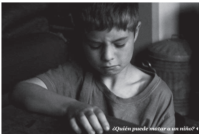
¿Quién puede matar a un niño? ◀