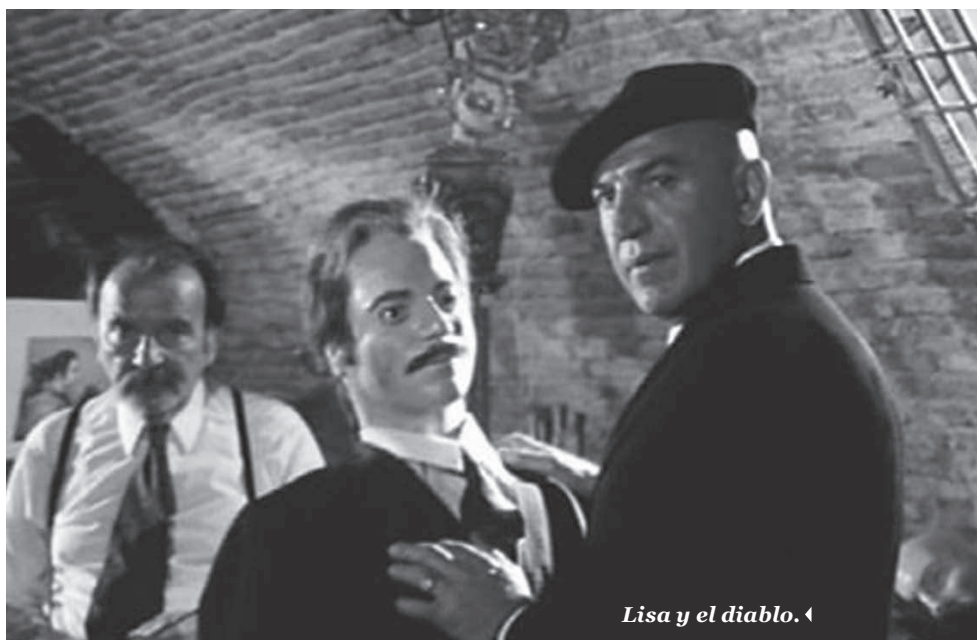
Lisa y el diablo. ◀