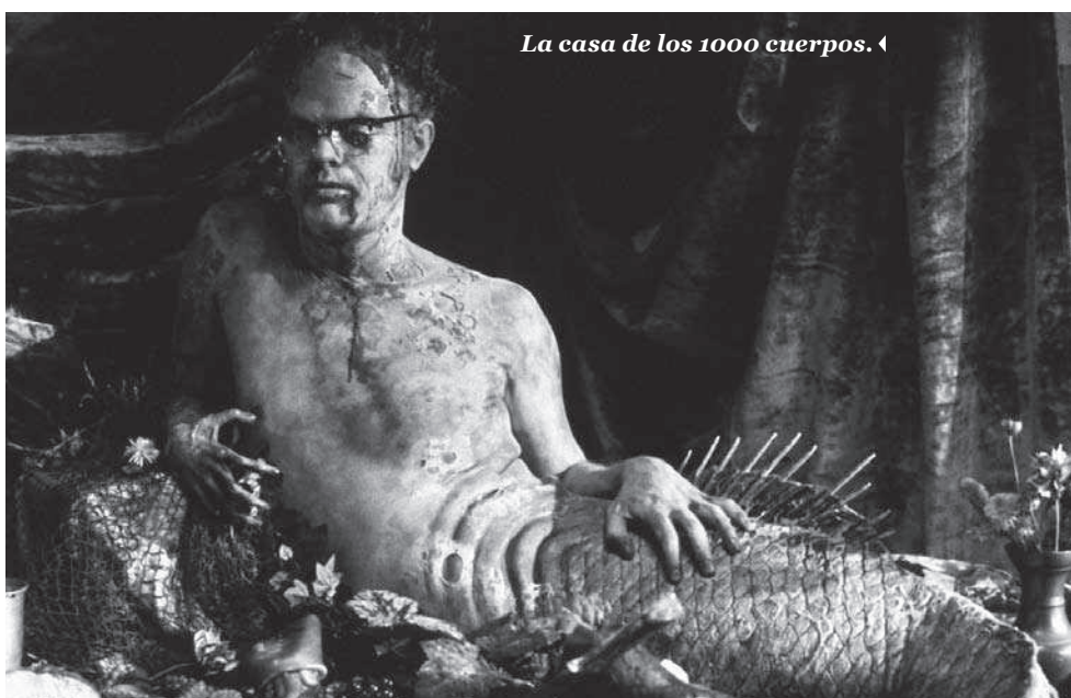
La casa de los 1000 cuerpos. ◀