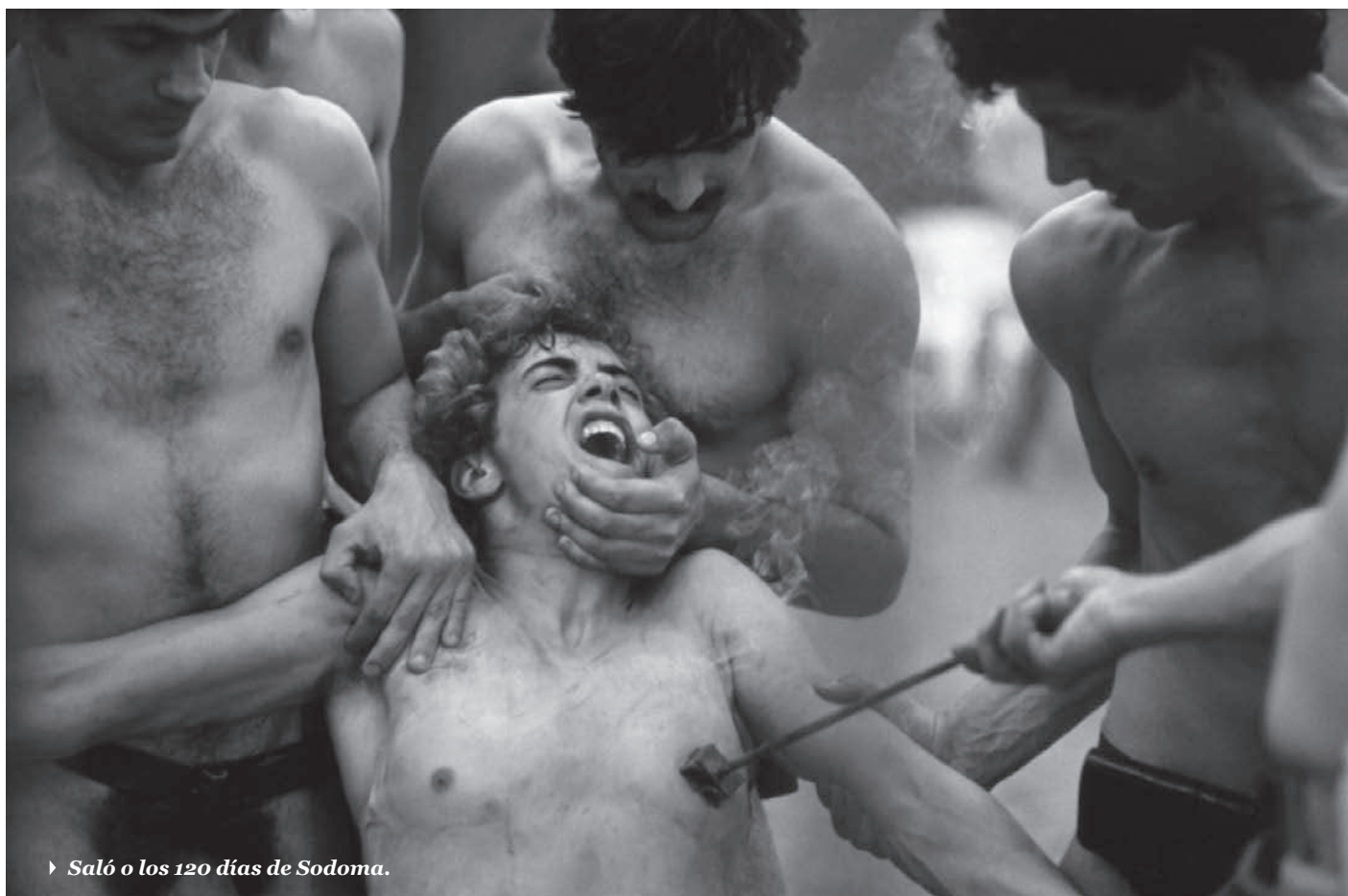
► Saló o los 120 días de Sodoma.

por la participación de la dupla Borges-Bioy Casares en su argumento, que se sostuvo a la par de su invisibilidad. La existencia de copias del filme alcanzó por décadas un perfil casi tan mítico como el de su relato.