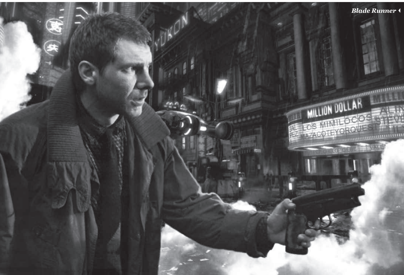
Blade Runner ◀

Hacer el mal, escribe Sade, no solo es más sencillo que hacer el bien, sino que siempre se alcanzan mayores placeres con él. Pasolini adapta el discurso sadiano sobre la necesidad de negar la virtud para alcanzar el placer, pero lo carga de un cariz político (el joven Enzo levantando el puño justo antes de ser acribillado por los libertinos fascistas) que hace que hasta hoy resulte tremendamente actual. Su rabioso discurso moral, su negación de la felicidad y su retrato del ser humano como hombre entregado al deleite de la vejeción ajena, parecen sacados del periódico de hoy. Pasolini actualizó a los libertinos de Sade encarnándolos en