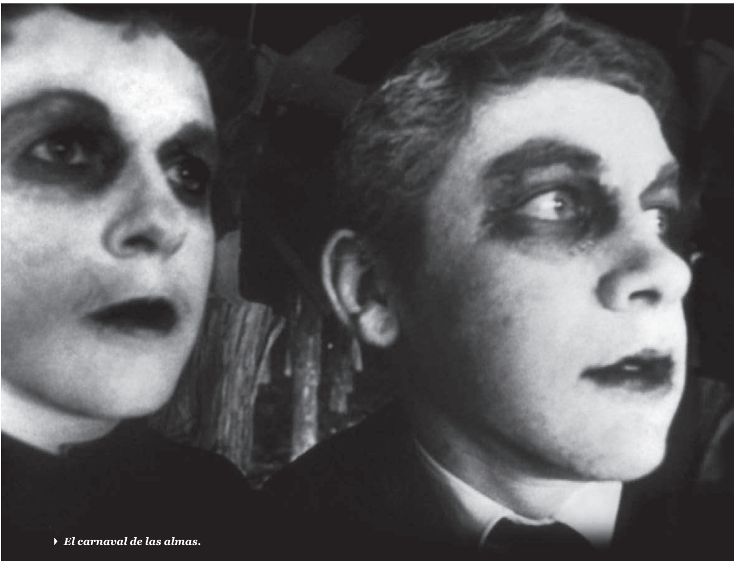
► El carnaval de las almas.