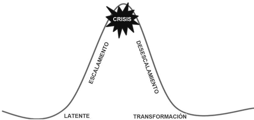
Gráfico 1 Ciclo de vida de los conflictos

En los ámbitos local, regional y nacional los medios dan visibilidad a los conflictos; participan en todos los procesos, al inicio, durante y después de las crisis; y muestran los acuerdos. Los medios tienen, pues, un rol decisivo que, a nuestro juicio, afecta el curso de los acontecimientos, contribuyendo al enfrentamiento entre las partes. Pero, al mismo tiempo, pueden jugar un rol preventivo para evitar el escalamiento o separar a las partes durante las crisis y aportar en la transformación de los conflictos.