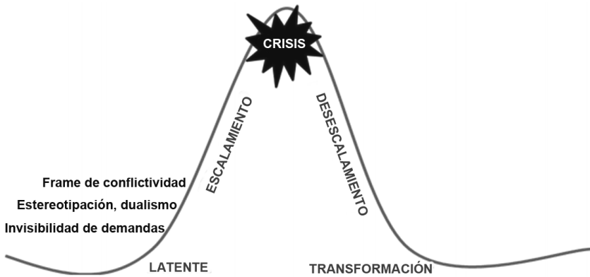
Gráfico 2 Roles de los medios en la fase latente de los conflictos

1999). Asimismo, los decisores, sean autoridades, funcionarios o la clase política en general, también se informan a través de los medios, y gracias al seguimiento que hacen sus gabinetes de prensa, incluso toman conocimiento de los hechos antes que sus propios sistemas de inteligencia. En pocas palabras, dan existencia pública a los conflictos.