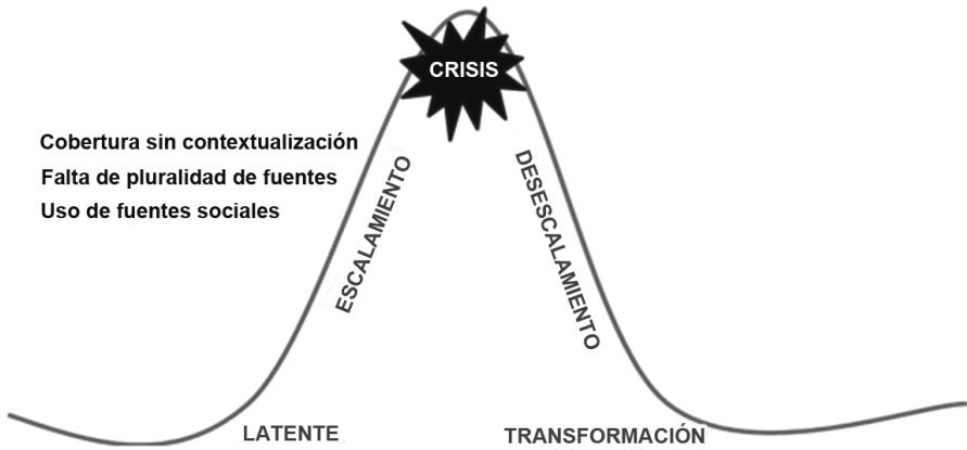
Gráfico 3 Roles de los medios en la fase de escalamiento de los conflictos

sucedió con la ocupación pacífica por los campesinos cocaleros de las instalaciones de la hidroeléctrica de San Gabán, en Puno, en el 2004, para solicitar el uso del teléfono con el fin de comunicarse con las autoridades de Lima y pedir ser incluidos en el programa de desarrollo alternativo (SER 2004). La cobertura de los medios locales y su posterior rebote en los medios nacionales hicieron referencia a una “toma de la hidroeléctrica”, aludiendo a que sectores afines al grupo terrorista Sendero Luminoso estaban detrás del hecho. En el relato se dejó de lado la voluntad de diálogo e inclusión que había motivado la movilización campesina. A pesar de los esfuerzos del alcalde por esclarecer la finalidad de