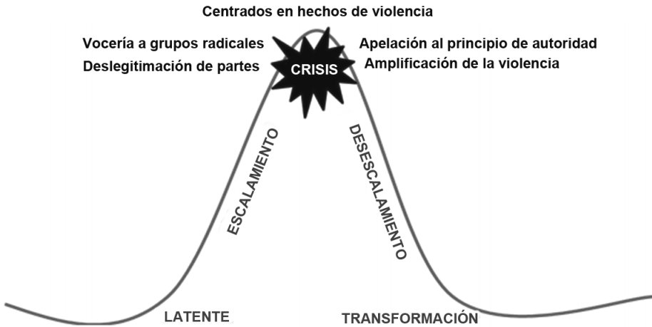
Gráfico 4 Roles de los medios en la fase de crisis de los conflictos

Por otro lado, los medios no siempre pecan por omisión, sino que muchas veces militan a favor de una de las partes, rompiendo no solo el principio de objetividad, sino también los de imparcialidad y tolerancia. Especialmente durante las crisis, muchos medios suelen incentivar las movilizaciones y defender acérrimamente las causas, sin realizar periodismo de investigación. En Bagua, región amazónica del Perú, poco después de un cruento desalojo de una carretera donde varios policías e indígenas habían muerto, la emisora radial La Voz de Bagua informó sobre una treintena de indígenas muertos, mostrando el desalojo como una masacre. Pero la verdad era otra: habían muerto diez indígenas y un número mayor de policías. Sin embargo, esta noticia "en caliente", sin ser corroborada, llegó