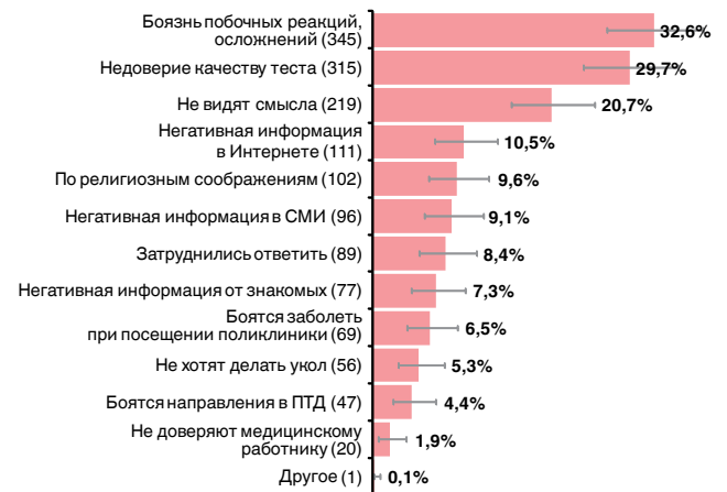
Рис. 1. Причины отказов от мероприятий по массовой иммунодиагностике туберкулеза у детей. В скобках – число респондентов, давших ответ. Горизонтальными полосами показаны границы 95%-ного ДИ

Распределение причин отказа законных представителей детей от мероприятий по массовой иммунодиагностике туберкулеза у детей показано на графике (рис. 1).