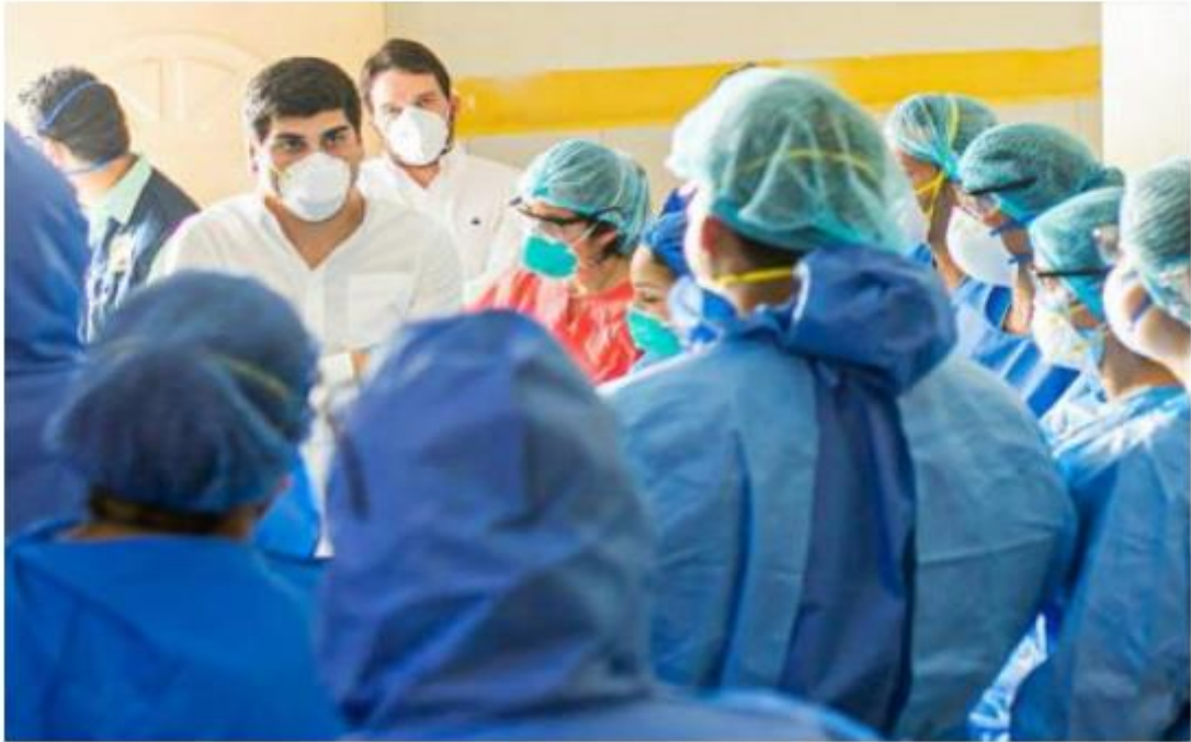
El personal del Hospital Martín Icaza, de Babahoyo, se reunió con el Vicepresidente.

Esta obra está bajo una Licencia Creative Commons Atribución-NoComercial-Compartir Igual 4.0 Internacional