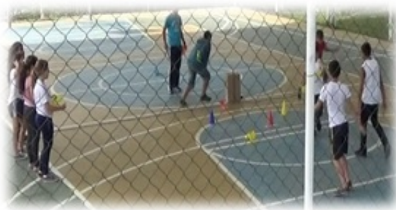
Figura 4 - Jogo de Caça Primitiva

Um aluno estava com dificuldades em acertar o alvo (animal selvagem) e derrubou com a mão quase que de forma invisível e comemorou perpassando aos outros o seu êxito e a forma de conquista-lo, o que foi seguido pelos colegas ao se depararem com a mesma situação.