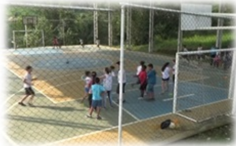
Figura 3 - Foto da vibração e interação entre alunos

Um aluno demonstrando estar extremamente feliz comentou: “nem acredito que fiquei até o final, esperava participar apenas”. Ele foi bastante resiliente em continuar o percurso, mesmo aparentando estar exausto. Para surpresa de muitos, pois, o mesmo não participava muito das atividades observadas anteriormente e assim não demonstrando interesse em atividades que exigiam esforço físico.