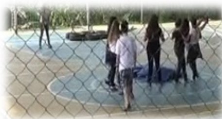
Figura 5 - Saltar Obstáculos Coletivamente

[...] os alunos tiveram a sensibilidade de enxergar o outro, tomaram uma pessoa nos braços e carregaram para o outro lado da corda, passando sem cometer erros. Uma aluna, com dificuldades para transpor a altura estabelecida, foi carregada e passou o “lago” para comemoração de todos que partilharam dessa situação.