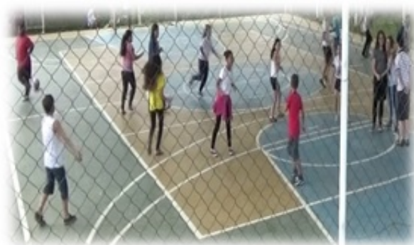
Figura 2 – Interação e mediação os alunos

Ao optarem em abraçar os colegas que tinham maior afinidade, discutiu-se sobre a possibilidade de deixarem um colega na selva para os animais selvagens devorarem, pois esse era o ambiente simbólico estabelecido. Assim, após a intervenção docente acabaram abraçando à todos, independentemente da relação que estabeleciam fora do momento da aula. Logo, houve participação de todos os alunos, tornando o ambiente do jogo, um espaço de alegria, prazer e descontração e convivência social.