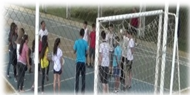
Figura 1 - Apresentação de imagens e fotos referentes ao atletismo

A primeira resistência à proposta apresentada se deu em função da predominante cultura do futebol como conteúdo hegemônico. E a partir daí, o questionamento provável, surgiu! Um aluno interrogou quando teriam futebol, com apoio e cumplicidade de muitos. (O autor)