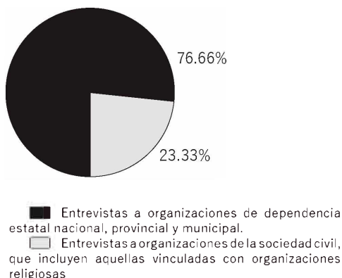
Grafico nº 2