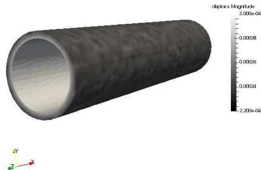
Figura 2: Cilindro con presión interna.