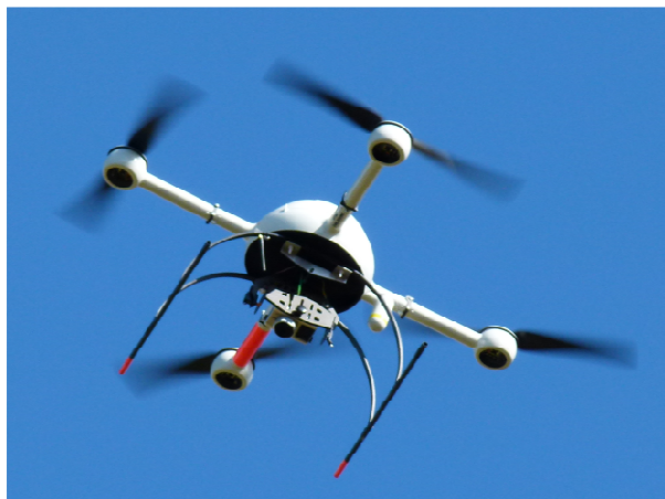
Figura 2. MD4-1000 em operação equipado com a câmera Olympus EP1.

Este artigo busca relacionar as ferramentas das geotecnologias com as necessidades da gestão administrativa utilizando-se para tal de um Veículo Aéreo Não Tripulado (VANT) no levantamento de dados por imagens aéreas. O veículo aéreo relacionado é um Microdrone MD4-1000. A Figura 2 apresenta o equipamento em operação.