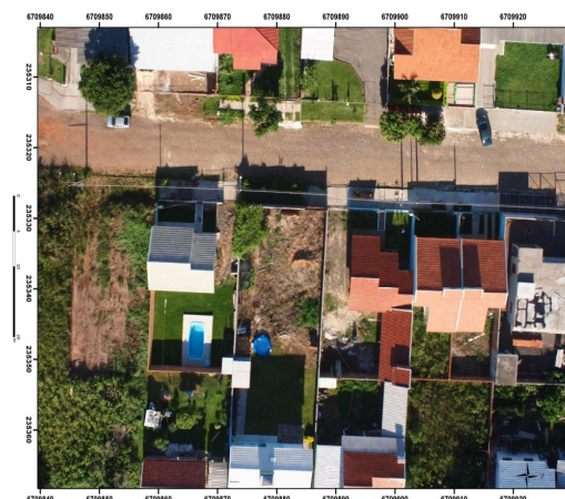
Figura 4. Mosaico georreferenciado com imagens obtidas no voo 082 a 82,5m de altura, bairro Novo Horizonte – Santa Maria – RS.

A segunda área a ser levantada foi na região urbana de Silveira Martins-RS, onde após o procedimento inicial, foi executado pelo drone MD4-1000 o voo 099 a uma altura média de 140,48m. Nesse voo, foram obtidas 23 imagens que juntamente aos dados de campo resultaram no mosaico georreferenciado da Figura 5.