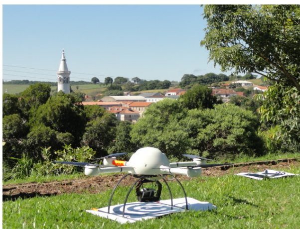
Figura 3. Posicionamento inicial do drone e alvo de referência.

Após, o equipamento foi ligado e por meio do rádiocontrole (RC), orientou-se a câmera na visada vertical, realizou-se a decolagem, o drone foi elevado até uma altura predefinida, o voo foi realizado e a câmera fotográfica acionada em intervalos regulares predefinidos. A finalidade do alvo foi para materializar o ponto inicial, já que o drone capta as coordenadas desse ponto e as utilizam para referenciar todas suas ações, inclusive os procedimentos autônomos de segurança.