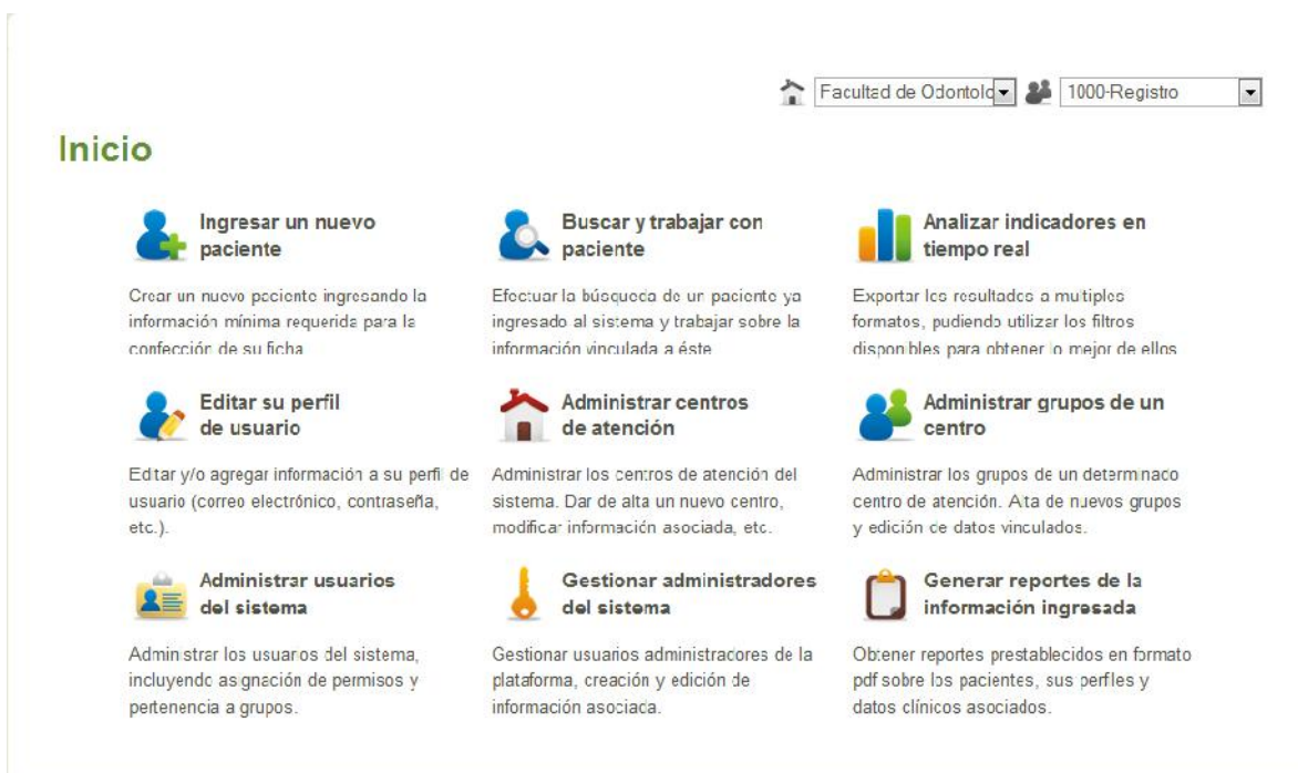
Figura 3 – Menú de inicio de la aplicación web REDIENTE. Notar las funciones habituales para gestionar el ingreso de datos clínicos junto con asignaciones de usuarios y centros de atención. El generador de informes agrupa indicadores sobre poblaciones seleccionadas, con fines epidemiológicos, de control de calidad y de seguimiento docente.