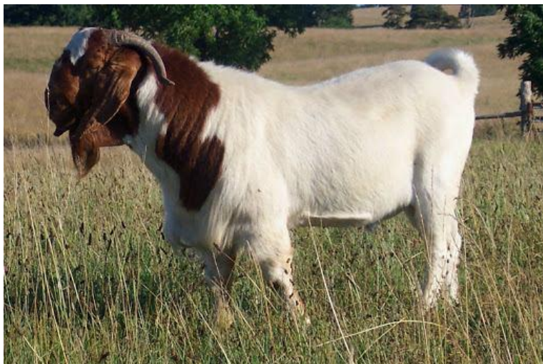
Gambar 5. Kambing Boer