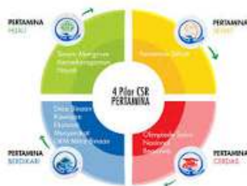
Gambar 2. 4 Pilar Utama CSR PT. Pertamina (Persero)

Di bawah payung tema “Pertamina Sobat Bumi”, PT. Pertamina (Persero) mengimplementasikan program CSR untuk tujuan CSR yang sesuai dengan konsep Tripple Bottom Line , yang meliputi people, planet, and profit (3P). Tujuan ini menjadi fokus PT. Pertamina (Persero) dalam menjalankan operasinya, di mana produk-produk yang dikembangkan dan jasa yang diberikan peduli terhadap kelestarian lingkungan khususnya bumi untuk kepentingan dan masa depan generasi yang akan datang.