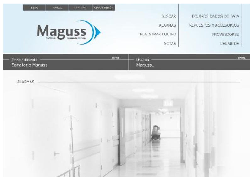
Imagen 1: Inicio del software. En este caso no hay alarmas programadas, en caso de haberlas se indican en esta ventana.

El menú de trabajo incluye las opciones contacto, manual, registrar equipo, buscar, notas, alarmas, equipos dados de baja, proveedores y repuestos y accesorios, como se grafica en imagen 1.