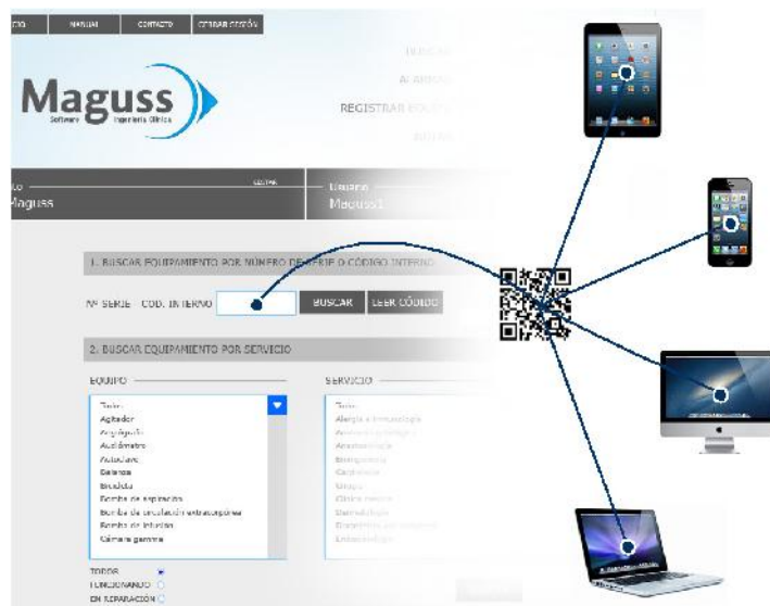
Imagen 4: Ingreso con código QR al código interno.

Si además este registro se hace en código QR el usuario puede leer la información del equipo mediante dispositivos como una cámara web, un teléfono celular o una tablet.