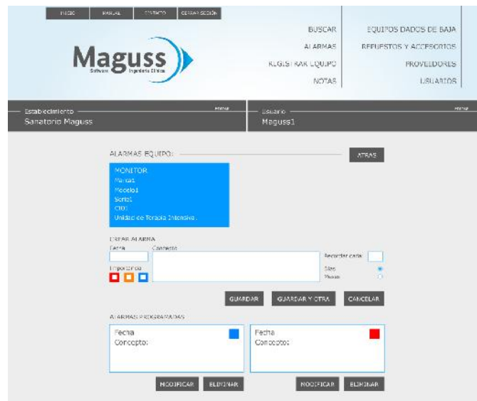
Imagen 2: Configuración de alarmas.