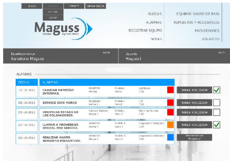
Imagen 3: Inicio del software con alarmas programadas.

Cada alarma presenta un casillero que puede tildarse para indicar que la actividad se está llevando a cabo. Cuando la misma se completa por un usuario y este lo indica a través de “tarea realizada”, los demás lo advierten. Esta indicación se mantiene durante la jornada, tal como se observa en imagen 3.