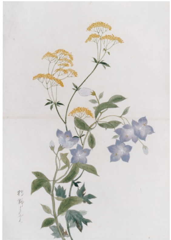
図7 狩野花兄筆『女郎花と桔梗図』