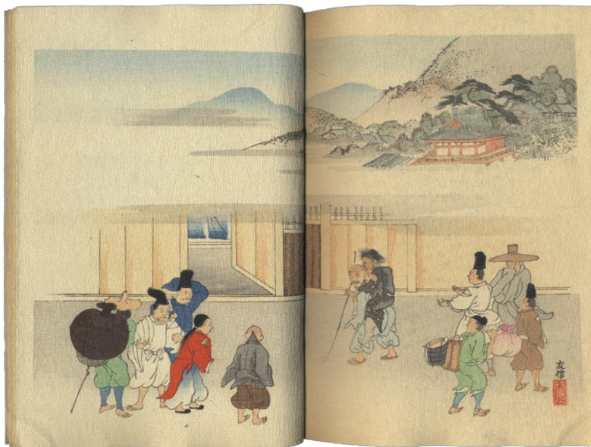
図3 『フロリアン寓話抄』より「目の見えない人と歩けない人」狩野友信挿絵