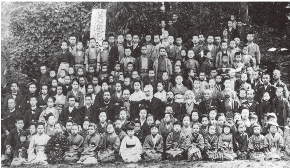
図2 「明治31年11月ベル博士東京盲啞学校訪問」狩野友信はベルの右側3人目

また明治31年10月には電話の発明で知られるアレキサンダー・グラハム・ベルが、クラーク聾学校で教え子であった妻メーベルと二人の娘を伴い来日し、11月12日に東京盲啞学校を訪問し、聾啞教育について講演した。講演の内容は次の5点に要約され、日本の聾啞教育に影響を与えた。