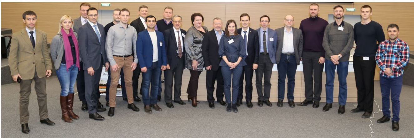
Рис. 15. Закрытие 4-го Международного научно-практического конгресса «Раны и раневые инфекции» Fig. 15. Closing of the 4th International Scientific and Practicel Congress “Wounds and wound infections”