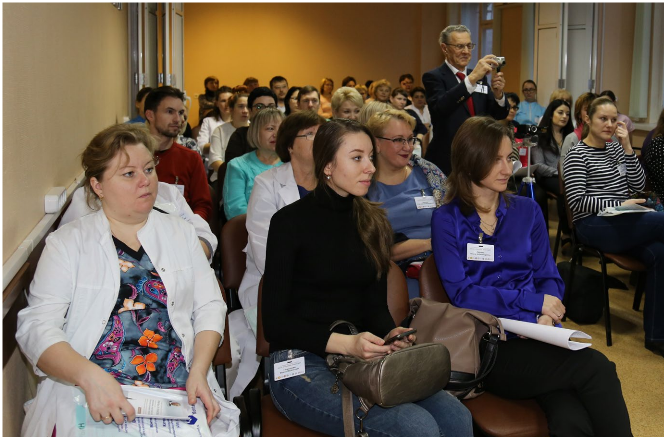
Рис. 12. Заседание «Особенности сестринского ухода при хирургической инфекции» Fig. 12. Session “Features of nursing care for surgical infection”