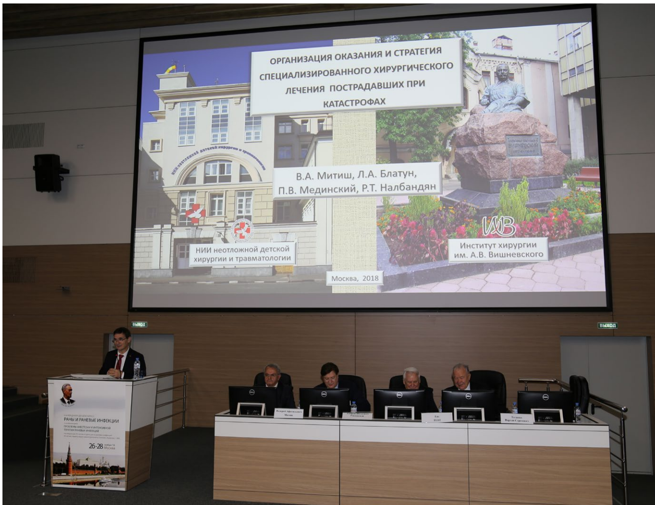
Рис. 2. Пленарный доклад Валерия Афанасьевича Митиша на открытии конгресса. В президиуме слева направо: Лус Теот, Амиран Шотаевич Ревишвили, Николай Иванович Рыжков, Павел Георгиевич Брюсов