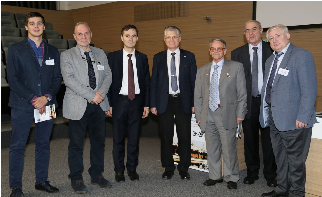
Рис. 14. Закрытие конференции «Проблемы анестезии и интенсивной терапии раневых инфекций» Fig. 14. Closing of the conference “Problems of Anesthesia and Intensive Care of Wound Infections”