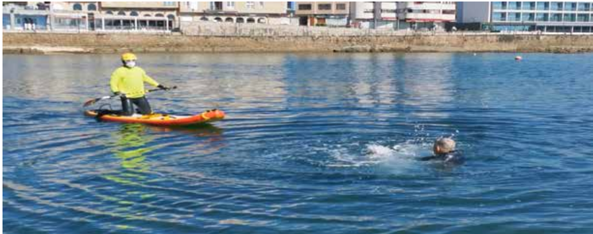
In conscious people, the lifeguard approaches on his knees to stabilize the board