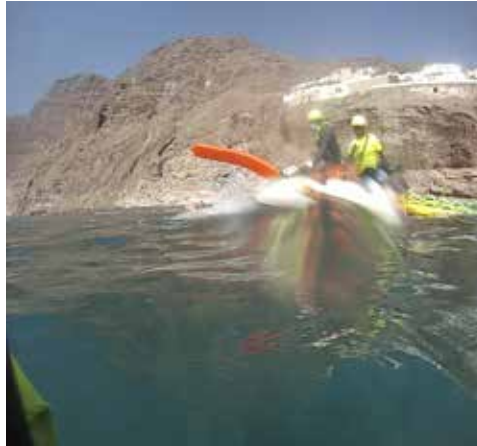
A rescue tube or marpa can be delivered to facilitate the maneuver