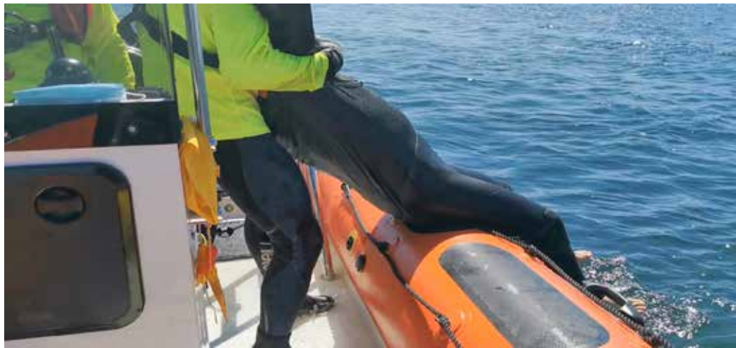
On the bulb it passes to control below the armpits of the rescued