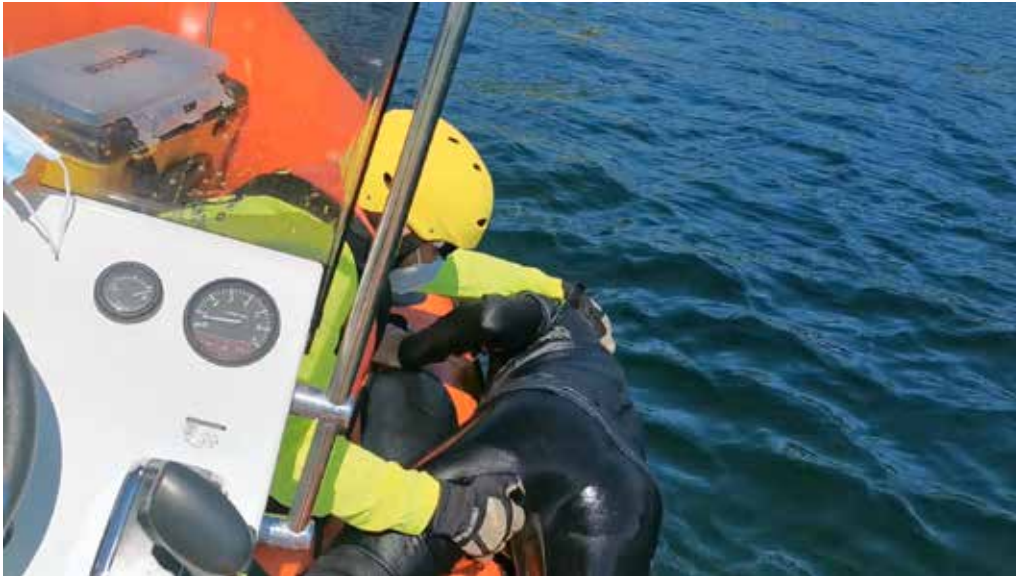
Si el rescatado no puede subir solo, el guardavidas le ayuda a subir y le insiste en que mire hacia delante

En los casos anteriores, si la persona no presenta dificultad respiratoria se puede colocar una mascarilla, o pedir que ella misma se la coloque. Pero si la persona rescatada presenta dificultad respiratoria es preferible aplicar oxígeno mediante máscara con reservorio.