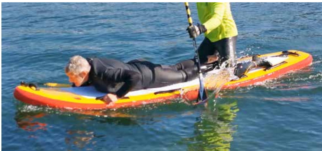
Tabla de paddle surf de rescate

En personas inconscientes, el guardavidas agarra al rescatado por sus muñecas y tira colocándole en decúbito prono (boca abajo), evitando exposición frontal