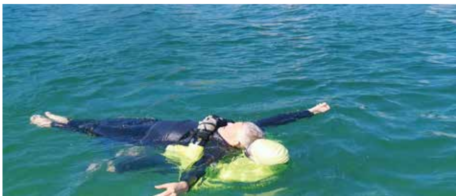
Place carabiner in ring avoiding approaching the face of the rescued