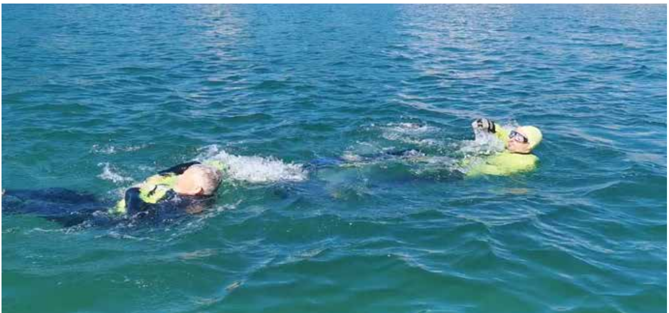
The lifeguard orders the rescued to turn around and asks him to help with footwork