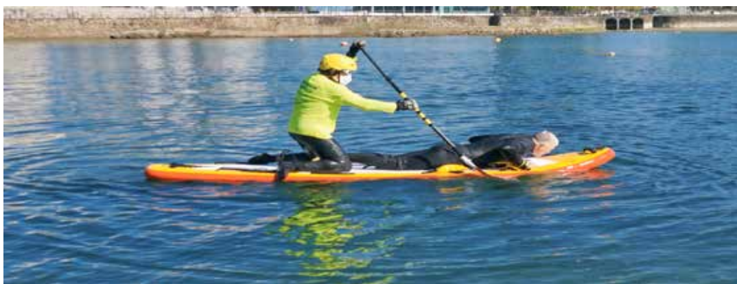
For greater stability, the lifeguard kneels down while moving