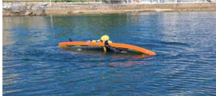
En caso de vuelco la cincha permite no perder al rescatado