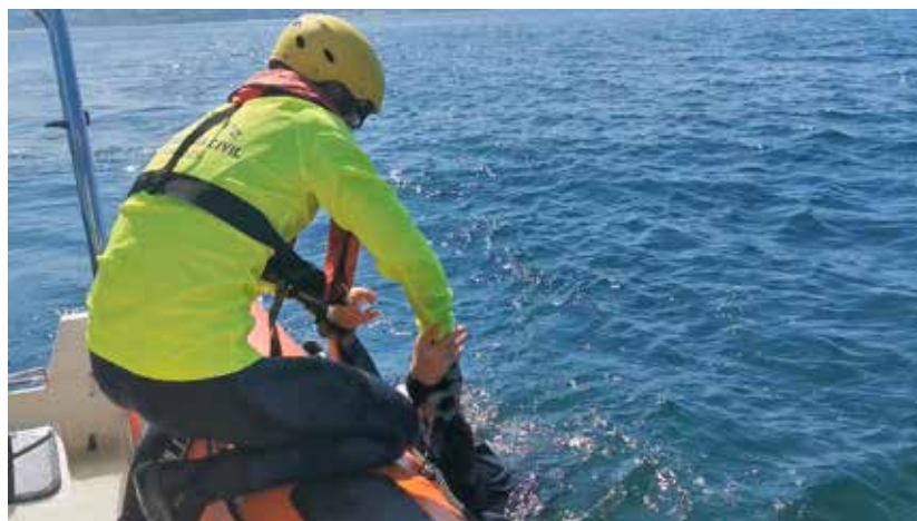
El izado del rescatado se inicia controlando sus muñecas y tirando fuerte hacia arriba