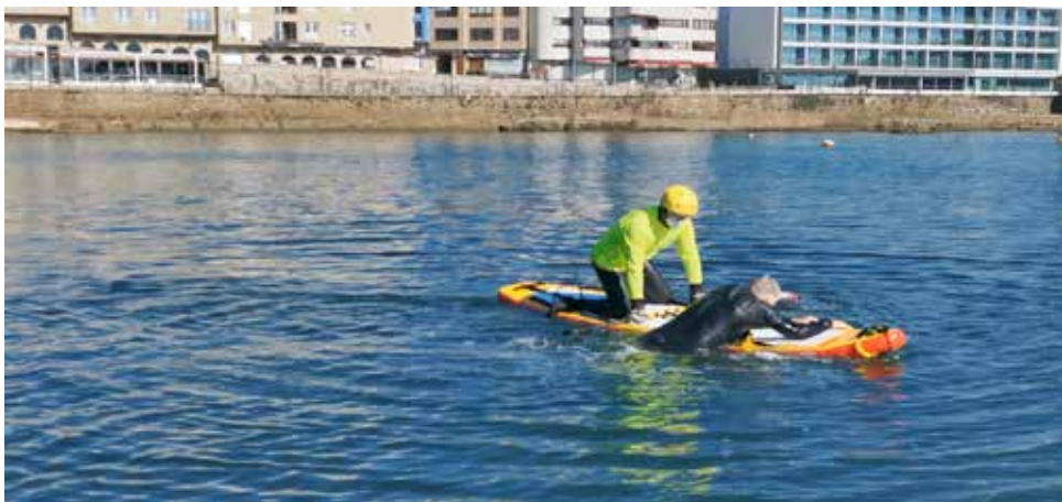
Indicates to the rescued to climb up and put on the leash