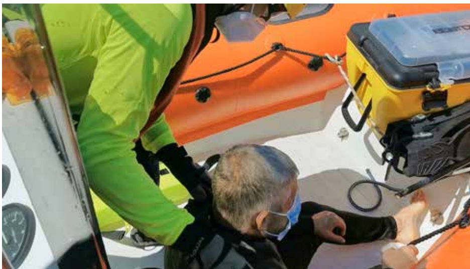
Si el rescatado no presenta dificultad respiratoria se le puede colocar una mascarilla

En los casos anteriores, si la persona no presenta dificultad respiratoria se puede colocar una mascarilla, o pedir que ella misma se la coloque. Pero si la persona rescatada presenta dificultad respiratoria es preferible aplicar oxígeno mediante máscara con reservorio.