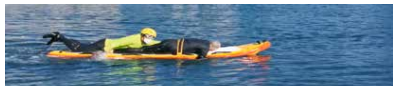
En esta secuencia se aprecia la facilidad para lograr el giro de la tabla sin perder al rescatado y comenzar de nuevo el traslado