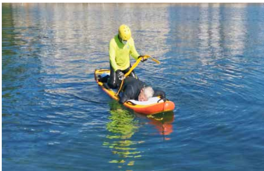
The lifeguard secures the rescued person with a strap and starts the transfer lying down for more stability