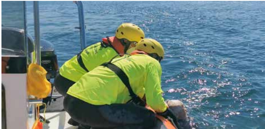
Si es necesario el patrón puede ayudar en el izado del rescatado