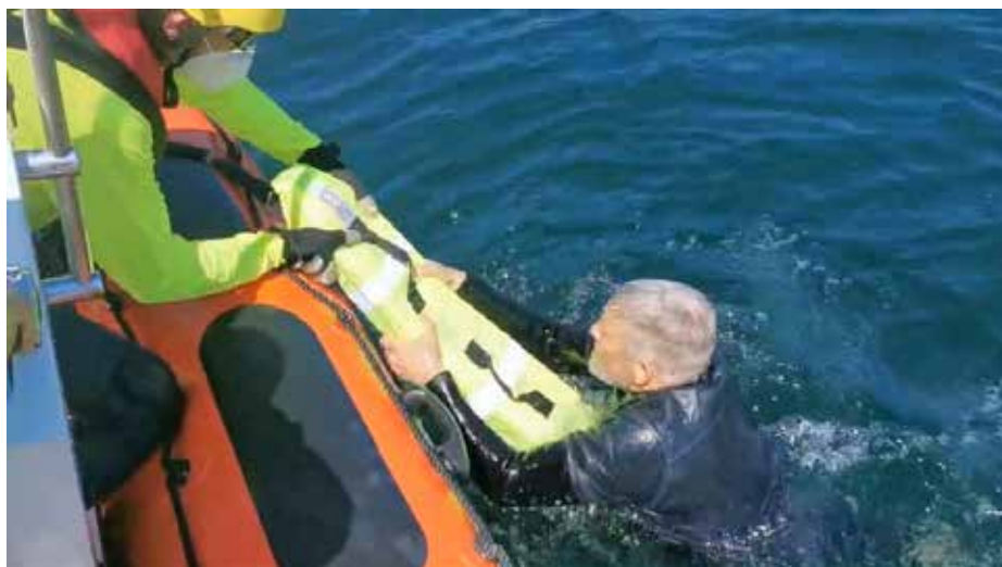
El guardavidas puede facilitar la maniobra utilizando un tubo de rescate o marpa