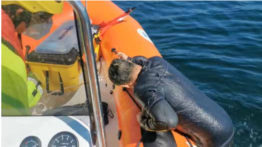
Rescatado sube sin ayuda y el guardavidas insiste en que mire hacia delante