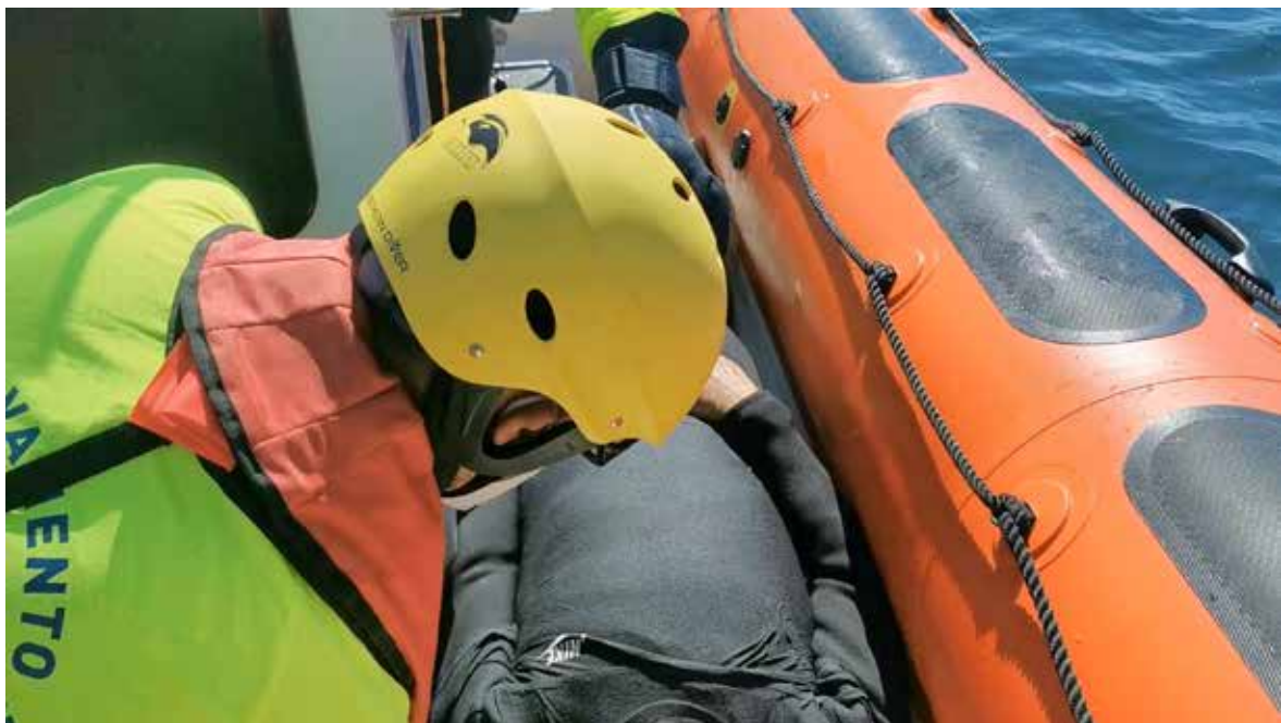
Se deposita al rescatado en un lugar adecuado para valorar si respira