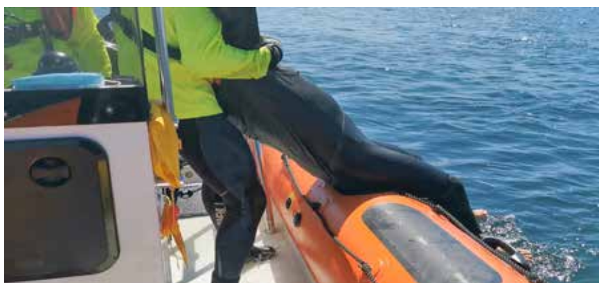
En el bulbo se pasa a control por debajo de axilas y agarre del antebrazo del rescatado