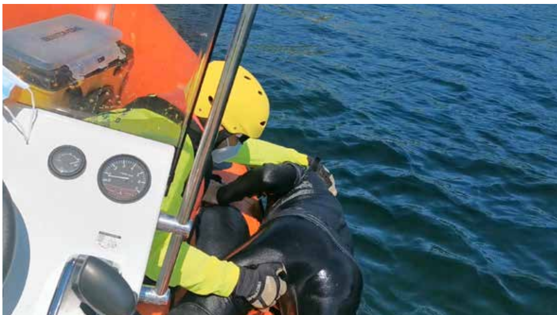
When the rescued person can not go up, lifeguard helps up and insists that he looks ahead

In the previous cases, if the person does not have difficulty breathing, a mask can be put on, or the person can be asked to put it on himself. However, if the rescued person has difficulty breathing, it is preferable to apply oxygen by using a mask with a reservoir.