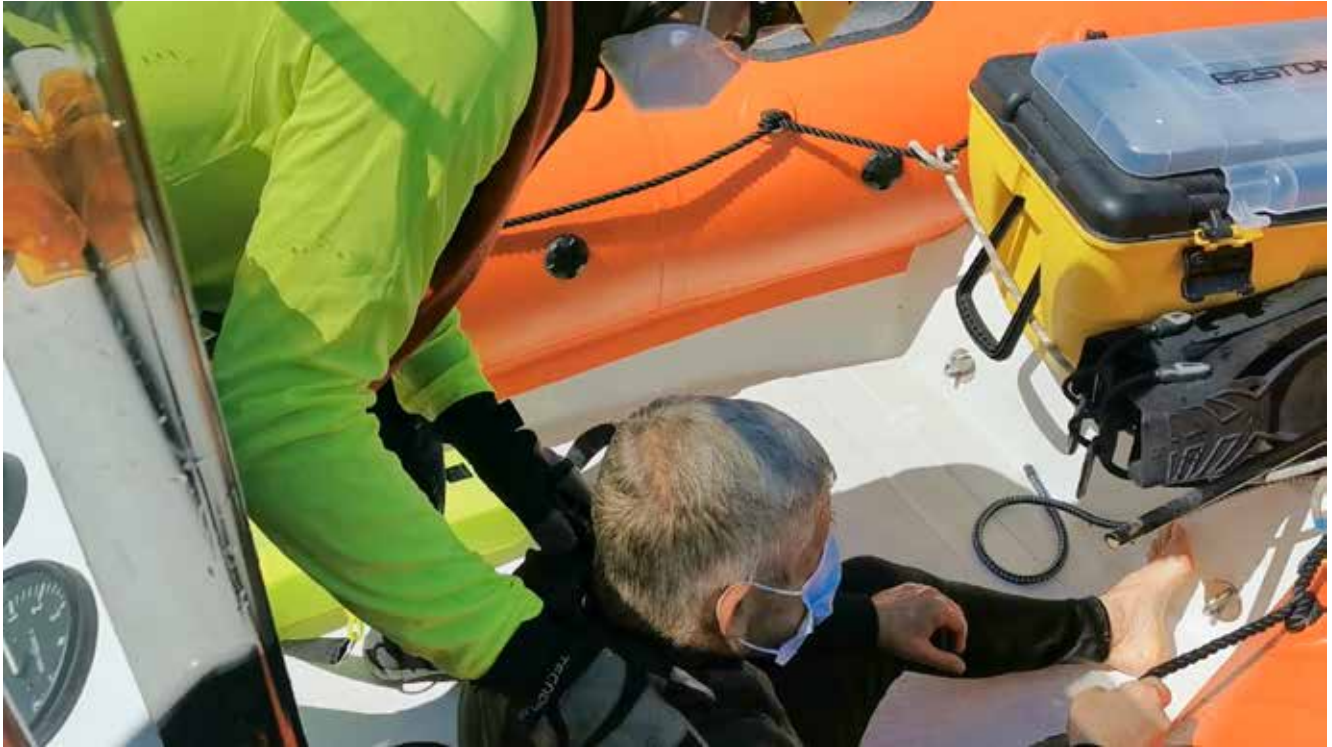
If the rescued person does not have difficulty breathing, a mask can be worn