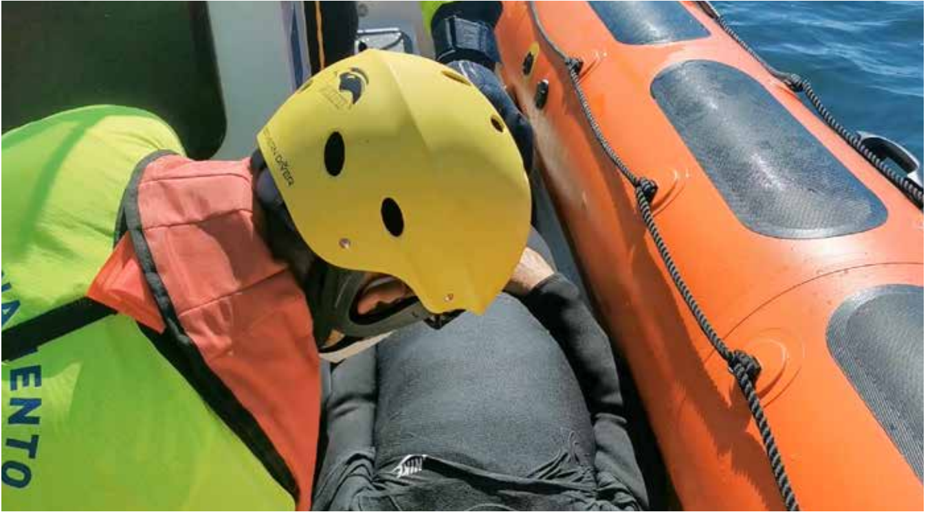
The rescued person is placed in the stern to assess if he or she is breathing