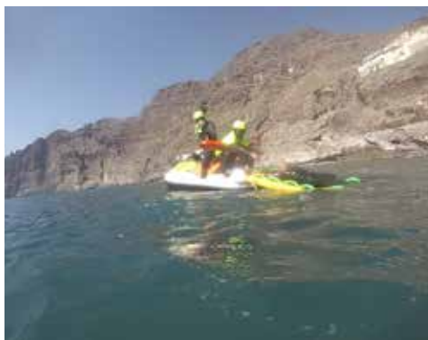
If the rescuer does not have difficulty breathing, a mask can be put on