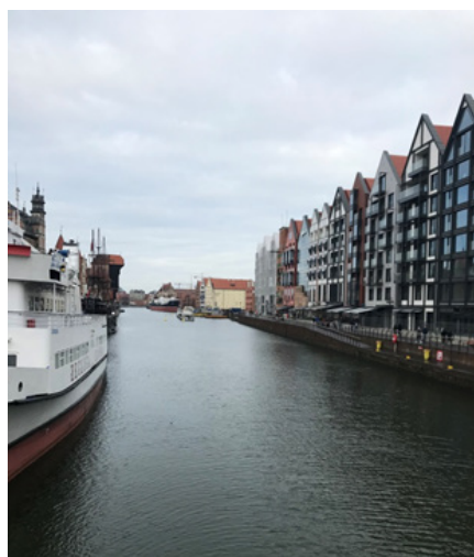
Fot. 3. Wyspa Spichrzów na Motławie