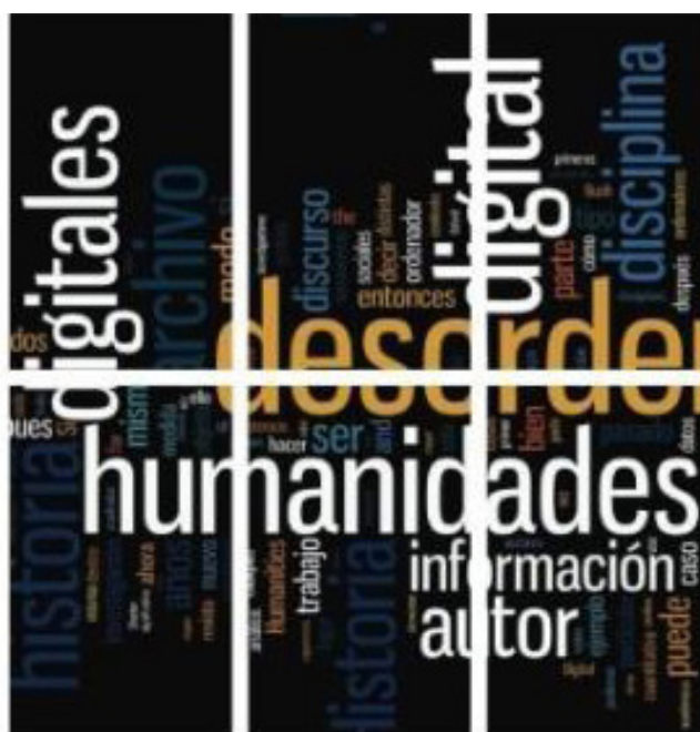
Detalle de la portada de El desorden digital. Guía para historiadores y humanistas , de A. Pons (2013)

Por otra parte, el papel que jugamos como aportadores de contenidos a los repositorios puede entenderse también como el esfuerzo necesario que debemos realizar