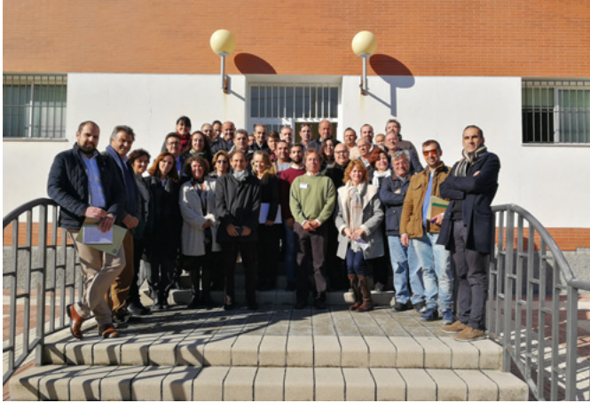
Participantes del encuentro

como interesados, generar una visión compartida y valorar la posibilidad de poner en marcha iniciativas vinculadas con la cal en Andalucía que repercutan en beneficio general de los participantes.