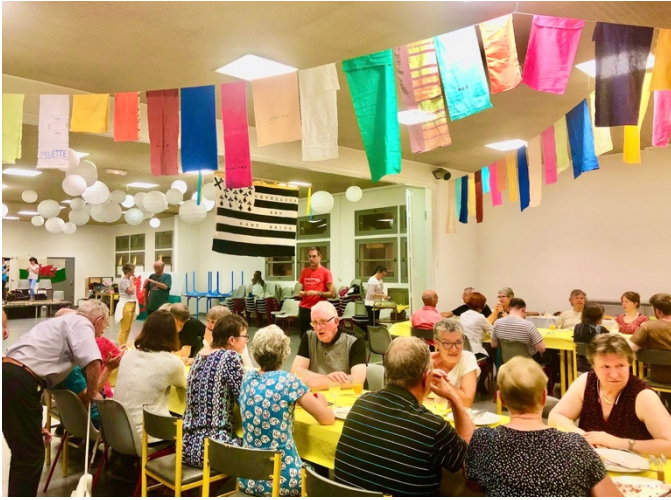
Swper cyfnewid dawsio, St-Brieuc