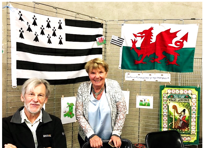
Fête des Associations Hennebont 2019

Dechreuodd trefeillio (Town twinning – 'jumelage' yn Ffrangeg) – yn bennaf ar ôl yr ail ryfel byd er mwyn adfer cysylltiadau da ymhlith cymdogion gwladol. Erbyn hyn mae trefeillio yn gyffredin ar draws Ewrop, o ddinasoedd at bentrefi. Mae trefeillio'n fwy na chytundeb swyddogol neu arwydd coffaol. Mae trefeillio'n caniatáu trigolion i gyfrannu. Mae digwyddiadau a gweithgareddau'n cynnwys: cymdeithasu, cyfnewidfeydd ysgolion, chwaraeon, cerddoriaeth a dawns, gwyliau a gwibdeithiau, dysgu ieithoedd, a dirprwyaethau swyddogol.