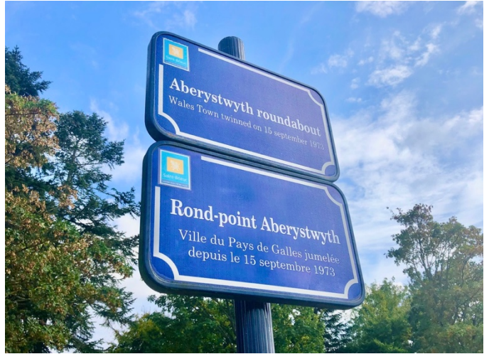
Cylchfan Aberystwyth St-Brieuc

Enwyd St-Brieuc ar ôl sant Cymreig, sef Briog. Teithiodd o Geredigion yn y 5ed ganrif, ac fe'i cydnabyddir fel un o'r saith sant a sefydlodd Llydaw. Erbyn heddiw adnabyddir y dref yn bennaf am gregyn bylchog (scallops) nodedig: y coquilles St-Jacques.