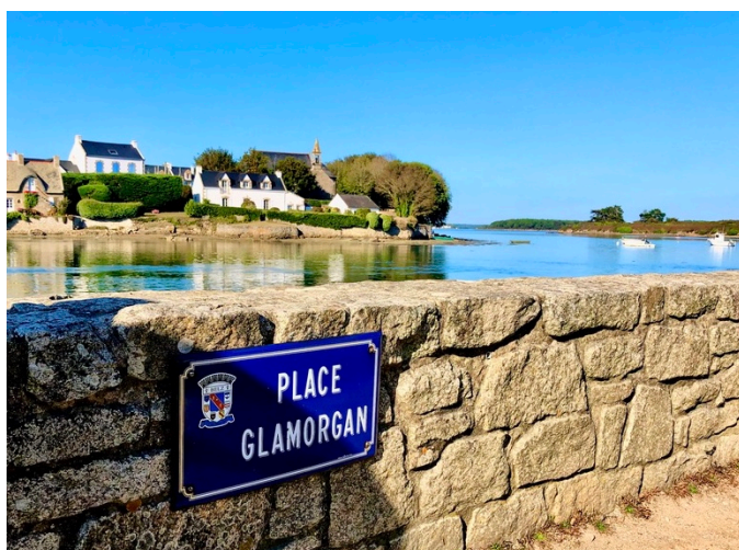
Ynys Cadog, ger Hennebont

Mae Hennebont ryw 15km o Lorient, un o borthladdoedd pysgota mwyaf Ffrainc, sy'n adnabyddus am yr ŵyl rhyng-Geltaidd flynyddol. Mae gan yr ardal gysylltiadau Cymreig hynafol. Croesodd y sant Cadog Môr Udd yn y 6ed ganrif, a chredir iddo fyw ar ynys yn Afon Etle, lle'i goffeir gan gapel. Yn fwy diweddar, cyfnewidiwyd coed Llydewig ar gyfer glo Cymreig, a gludwyd i fyny'r afon ar gyfer diwydiant Hennebont.