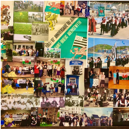
Cofion St-Brieuc – Aberystwyth