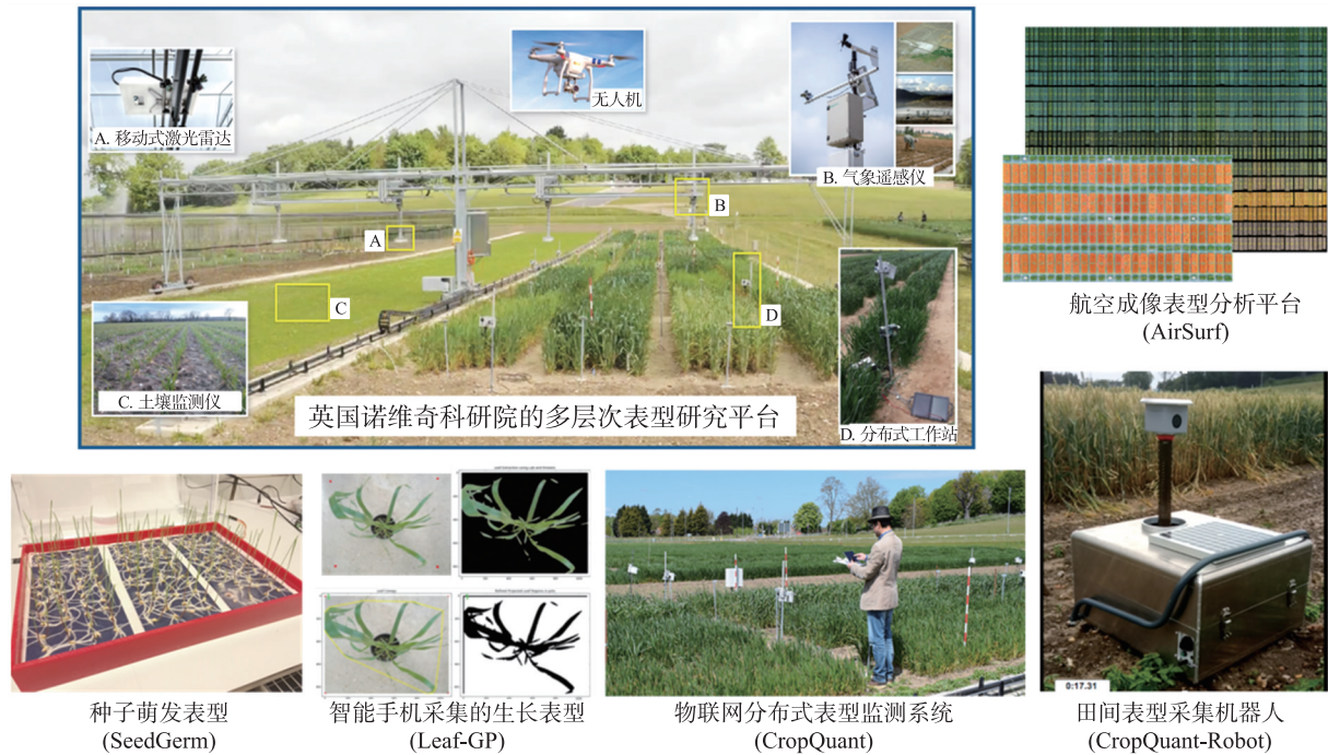
图2 英国诺维奇科学研究所使用的多层次作物表型平台

同开发的高通量室内水稻表型设施 (high-throughput rice phenotyping facility, HRPF) [38] , 德国 IPK 和浙江大学生命科学学院共同研发的基于 LemnaTec 系统的高通量植物生长和干旱反应分析系统 [39] 。本文将着重介绍讨论各类田间作物表型技术。