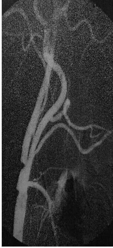
Resim 1a. Sağ karotid arterde %65 stenoz bulunan olgunun DSA görüntüsü.