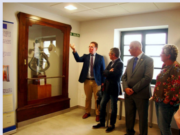
Figura 2. Inicio de la visita guiada a la exposición de Castropol. De izquierda a derecha: Delegado Territorial de AEMET en Asturias, Secretario de Estado de Medio Ambiente, Alcalde de Castropol y Teniente de Alcalde de Castropol.

Entre el 17 de agosto y el 1 de septiembre de 2018 estuvo abierta al público en Castropol (Asturias) la exposición «La Observación Meteorológica en AEMET, pasado y presente» en el salón de plenos del Ayuntamiento de Cas-