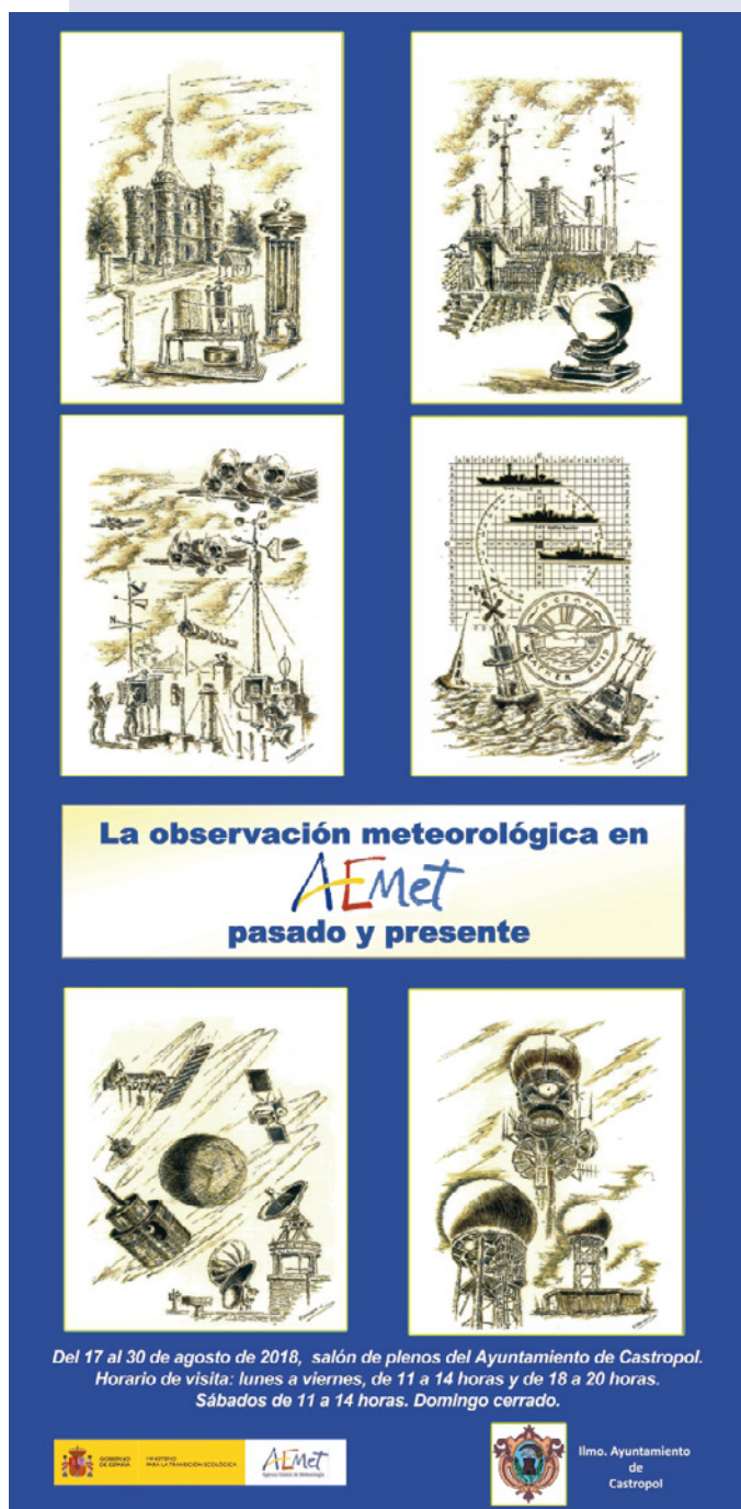
Figura 1. Cartel confeccionado por AEMET para la exposición de Castropol. Originalmente la exposición iba a estar abierta solo hasta el 30 de agosto, pero finalmente se amplió hasta el 1 de septiembre.

La exposición se realizó en Castropol con motivo de la restauración de un barómetro histórico de mareantes emplazado en esta localidad tras su construcción en el siglo XIX en Liverpool, que permitía a los marineros de Castropol saber cuándo se acercaba o alejaba una borrasca, y por el gran interés del Ayuntamiento de Castropol en que así fuese, que contribuyó con el local en el que se emplazó la exposición y con el personal que se hizo cargo de dicha exposición durante el período que estuvo abierta. Además, la exposición iti-