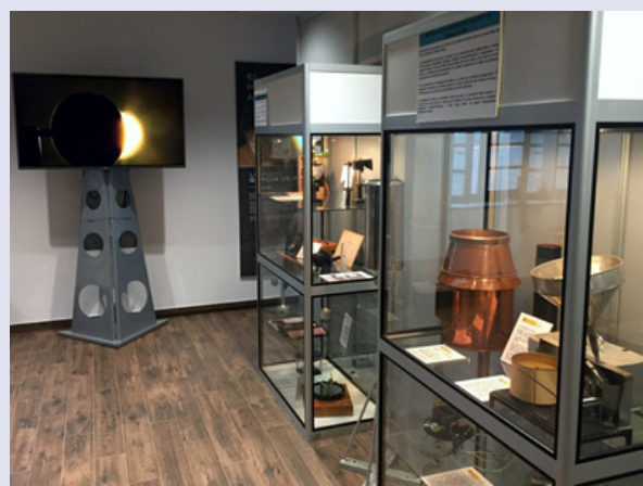
Figura 4. Dos de las vitrinas de la exposición y un monitor de TV (foto: Víctor González).

Ángel J. Gómez-Peláez, Yolanda Galván, Víctor González