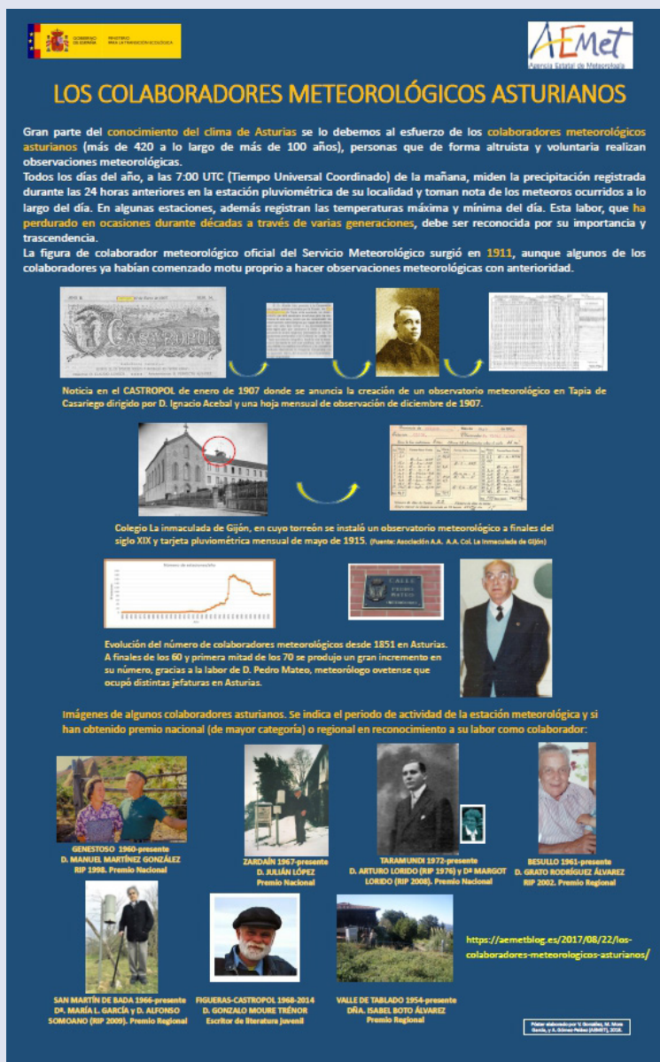
Figura 3. Póster sobre los colaboradores meteorológicos asturianos, uno de los tres de contenido asturiano que se hicieron expresamente para esta exposición..

nerante de AEMET no había estado en Asturias desde abril de 2014, durante la celebración en Oviedo de las XXXIII Jornadas Científicas de la AME y el XV Encuentro Hispano-Luso de Meteorología.