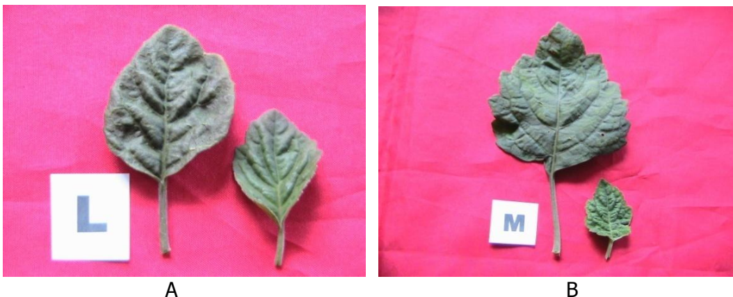
Gambar 1. Bentuk daun oval (A) pada aksesori Mahala dan bulat (B) pada aksesori TM2 Figure 1. Oval leaf (A) of Mahala accession number and spherical leaf of TM2 (B)

Jumlah daun dari 10 aksesori sangat bervariasi, antara 55,7-170,7 helai, tertinggi pada TM-2 (170,7 helai) asal Sumut berbeda nyata dengan aksesori SK (Penang, Subussalam, Aceh), Mahala (Pakpak Bharat, Sumut), Sipede 1 (Pakpak Bharat, Sumut) dan SM-1 (Subussalam, Aceh), tetapi tidak berbeda nyata dengan nomor lainnya. Sedangkan aksesori yang mempunyai jumlah daun terkecil terdapat pada nomor aksesori SM-1 (55,7 helai) asal Subussalam, Aceh panjang daun berkisar antara 6,5-8,2 cm, tepanjang terdapat pada aksesori LO-1 (8,2 cm) (Subussalam, Aceh) berbeda nyata dengan nomor aksesori Sipede 1 (Pakpak Bharat, Sumut), tetapi tidak berbeda nyata dengan nomor-nomor lainnya. Lebar dan tebal daun dari masing-masing aksesori tidak bervariasi (Tabel 2).