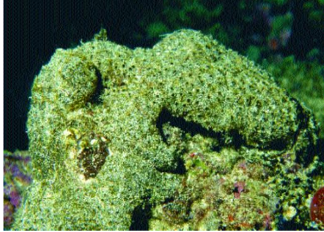
Gambar 1. Ascidian Eudistoma sp.