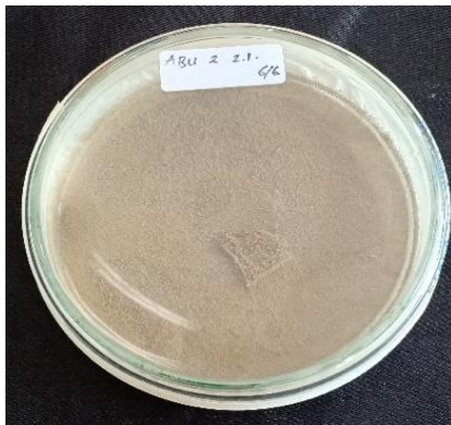
Gambar 2. Isolat Murni Jamur Simbion Eudistoma sp. (ABU2 2.1.)

Setelah didisolasi dan diinkubasi selama 2x24 jam, pada bagian sekitar sampel terlihat munculnya bercak berwarna putih. Hal ini menandakan adanya pertumbuhan dari jamur yang bersimbiosis dengan ascidian Eudistoma sp. Jamur yang tumbuh tersebut kemudian langsung dikultur dengan tujuan untuk mendapatkan isolat jamur yang murni. Isolat jamur dikultur sebanyak dua kali sehingga didapatkan isolat jamur yang murni.