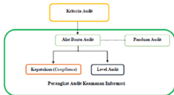
Gambar 2. Perancangan perangkat audit

Kriteria audit yang telah ditentukan pada bagian sebelumnya, dijadikan acuan dalam merancang perangkat audit.