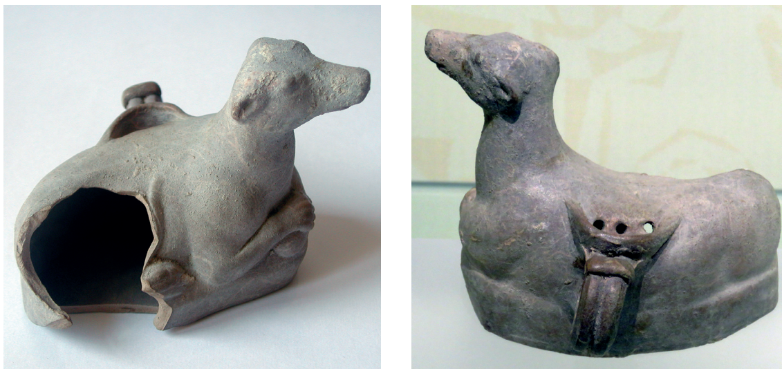
Figura 4. Parte delantera (1) y trasera (2) del guttus procedente del Cerro de San Lorenzo, Rusaddir (actual Melilla). Museo de la Ciudad Autónoma de Melilla (Foto Archivo J.M. Sáez Cazorla).

«no se guardase la unidad de los ajuares y se mantuvieran por separado», por lo que el análisis se realizó en conjunto, mediante fotografías enviadas desde Melilla.