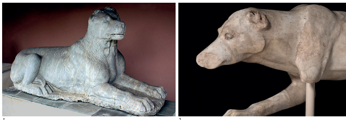
Figura 1. 1. Escultura de perro (posiblemente raza molossus) procedente de la Necrópolis de la Kerameikos, en Atenas al noroeste de la Acrópolis (Museo Oberlaender; foto de la reproducción en yeso del Metropolitan Museum of Art, Central Park, New York.); 2. Cabeza de posible perro de raza laconiana, puede haber pertenecido al Témenos de Artemis Brauronia (Brauron) adyacente a los Propíleos en la Acrópolis. Se atribuye a la época de Pisistrato o sus hijos (520 a.C.). Museo de la Acrópolis, Atenas. Diferente era el Melitaeus catullus (Ref. Acr. 143).

y Hécate, (que también está atestiguada en el mundo fenicio-púnico como analiza A.M a Niveau de Villedary) 7 incluso su fuerza y perseverancia le convierte en un monstruo mitológico como Cerberus , el perro de tres cabezas, guardián del Hades 8 .